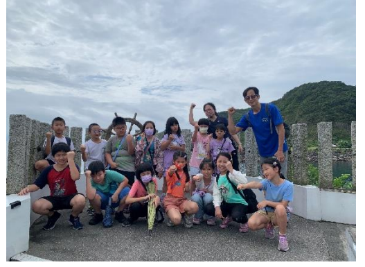
說明:豆腐岬的海景十分迷人。