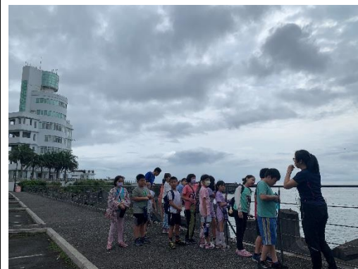
說明:豆腐岬是全世界第一個發現珊瑚產卵的地方。