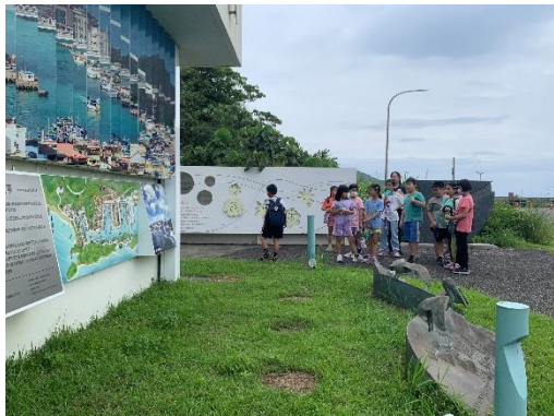
說明:感恩紀念牆上的六朵茉莉象徵，對6位外籍移工的感念與不捨。新橋是以鯖魚為造型。