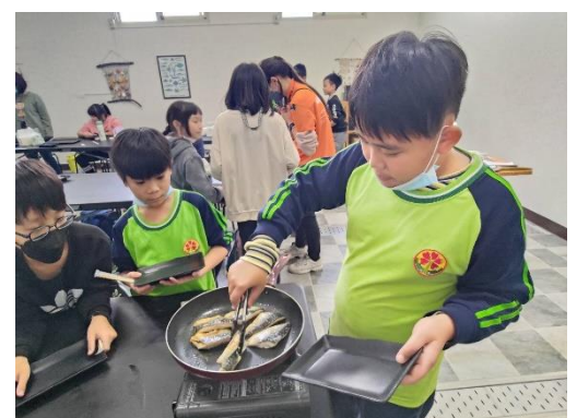
說明:陣陣魚香撲鼻而來，大西洋鯖油脂豐富，乾煎就很好吃!