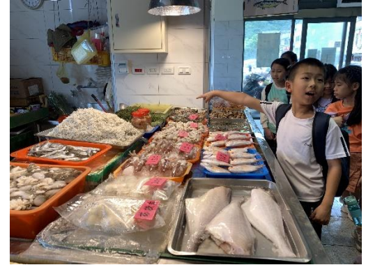
說明:除了鮮魚，還有各式的水產加工品，最讓大家驚奇的是一整盤的鮪魚眼睛。