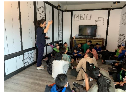
說明:模擬南方澳漁業鼎盛時期，許多戶人家擠一層樓。