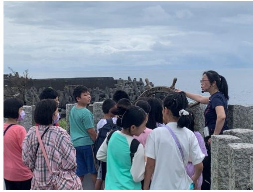
說明:豆腐岬的海景十分迷人。