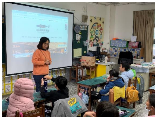
說明:出發前再次提醒學生安全事項