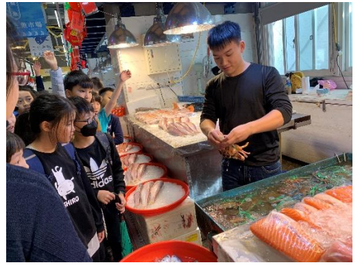
說明:造型獨特的南方澳第一拍賣魚市場，恆溫、整潔的販賣空間，以高規格食安為設計考量。