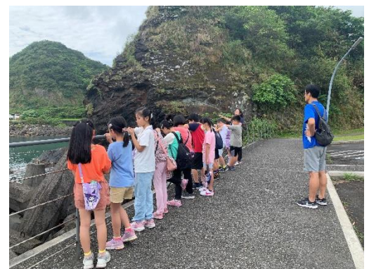
說明:這裡是一個開放水域，每到夏天總是吸引許多遊客到此。