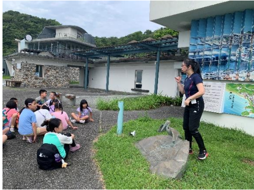
說明:留下昔日物品紀念南方澳大橋