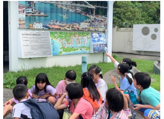
說明:牆上的照片從左看是舊橋從右看是新橋，訴說著大橋故事。