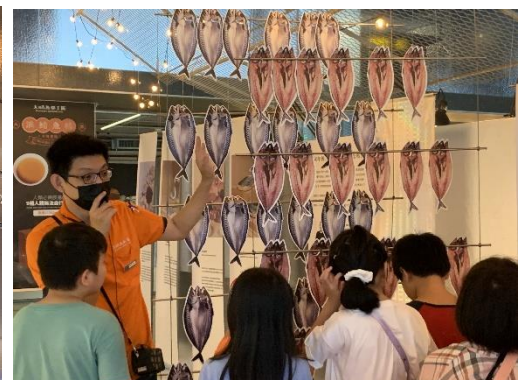
說明:從鯖魚種類到生長地，從捕撈到保鮮，從產地到餐桌，大鯖魚夢工廠推展永續漁業觀念，期許海裡永遠有魚喔!