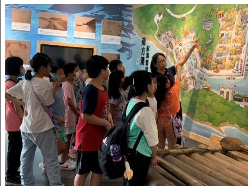
說明:認識南方澳大地圖