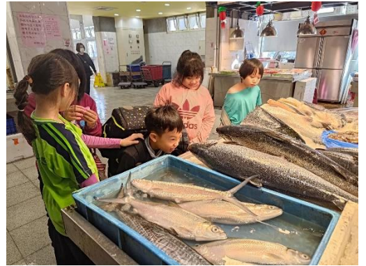
說明:不同的季節有不同的魚，攤商親切向學生解說著。能看到完整的全魚，學生們都十分好奇。