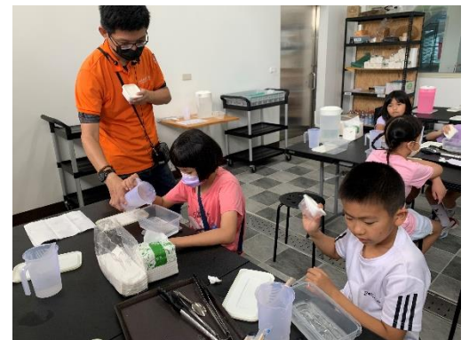
說明:料理是一種科學，鹽跟水的比例要對才能製作出鮮美的薄鹽鯖魚。