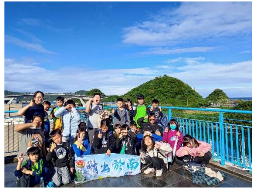
說明:魚市場的頂樓有正好百年漁港紀念展，從陳列的照片可以歸建南方澳發展史!