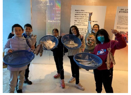
說明:花腹鯖、白腹鯖、大西洋鯖通通帶回家!