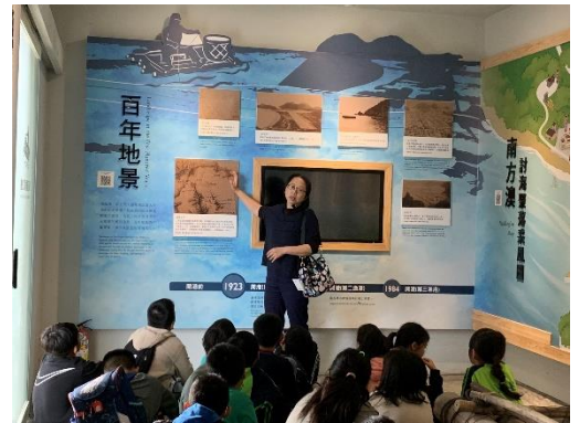
說明:參觀討海人文化館