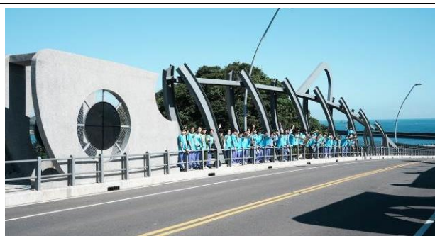
說明：走訪南方澳跨港大橋