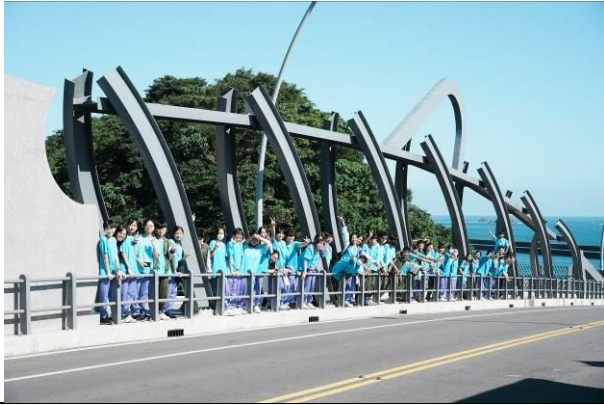
說明：走訪南方澳跨港大橋