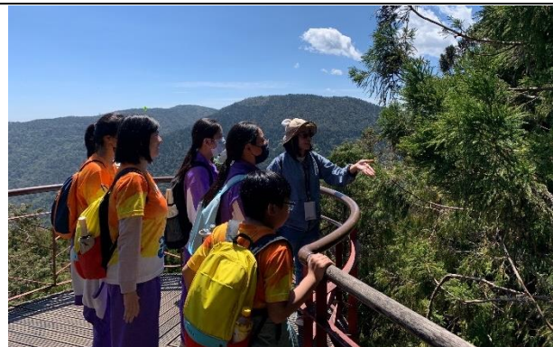
說明：介紹太平山上人工復植的柳杉林