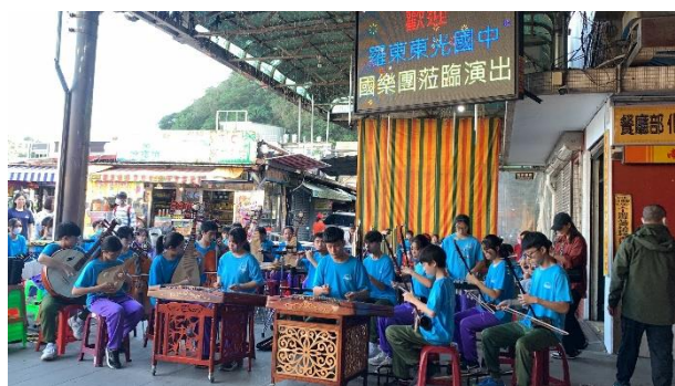
說明：我們還準備了國樂演出