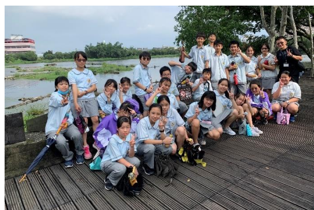
說明：全班在儲木池畔合影

(2) 詩文創作：學生透過導覽及觀察羅東林場的人文歷史、自然生態等，自行創作新詩、攝影作品等。