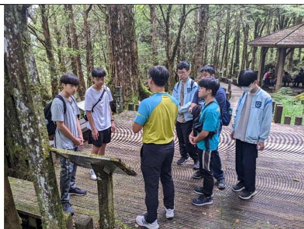
說明：宜蘭高中申請優質戶外教育路線