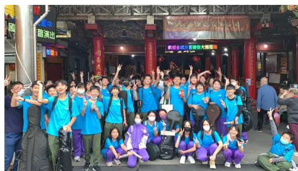
說明：在南天宮大合照