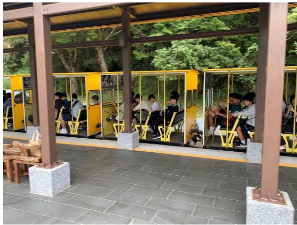
說明：體驗太平山蹦蹦車