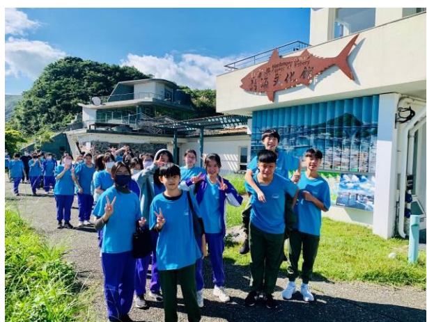
說明：參觀南方澳討海文化館