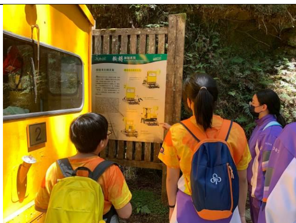
說明：蹦蹦車頭迴轉機關