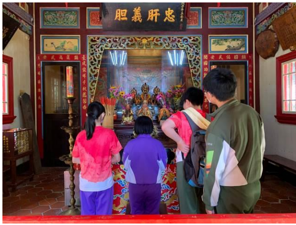
說明：太平山莊的鎮安宮是宜蘭縣境內海拔最高之廟宇