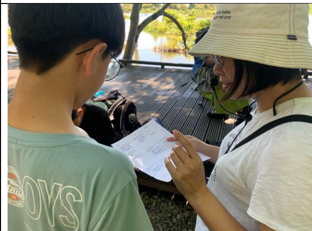
說明：與老師討論詩文創作