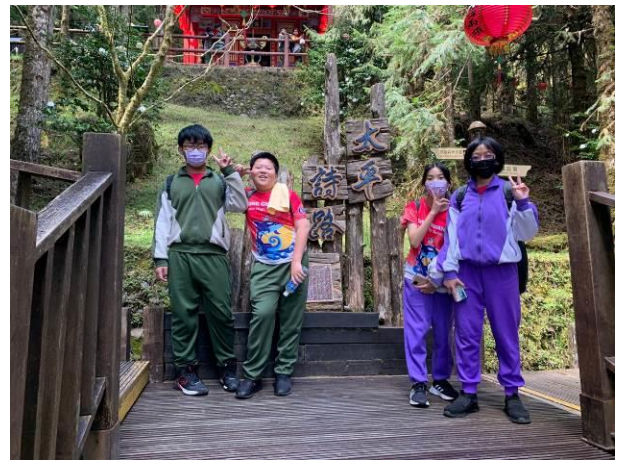
說明：走上太平詩路，進行與詩人的對話