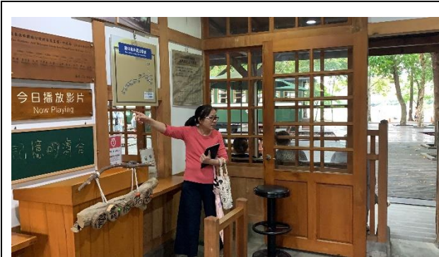
說明：老師介紹竹林車站及太平山林鐵