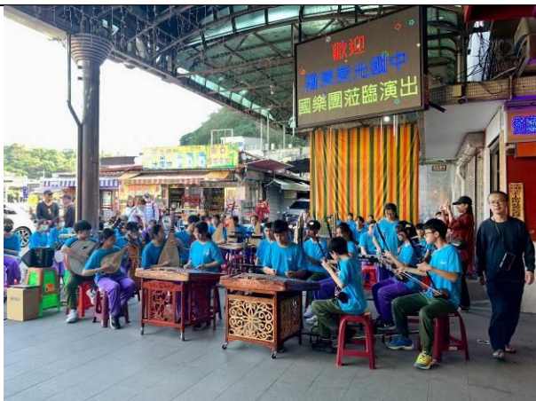
說明：帶來國樂演出