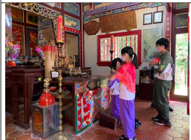
說明：太平山鎮安宮