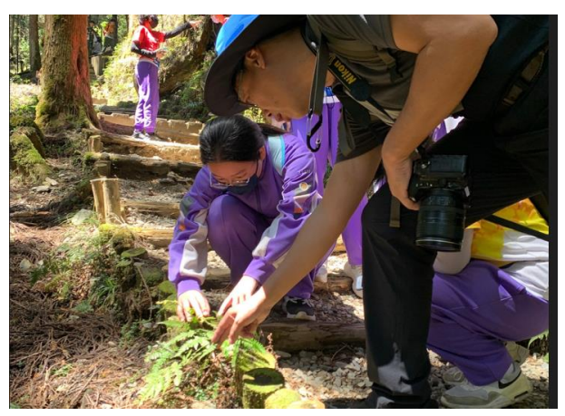
說明：介紹太平山常見的蕨類植物