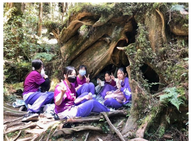
說明：在樹洞裡用午餐，特別美味