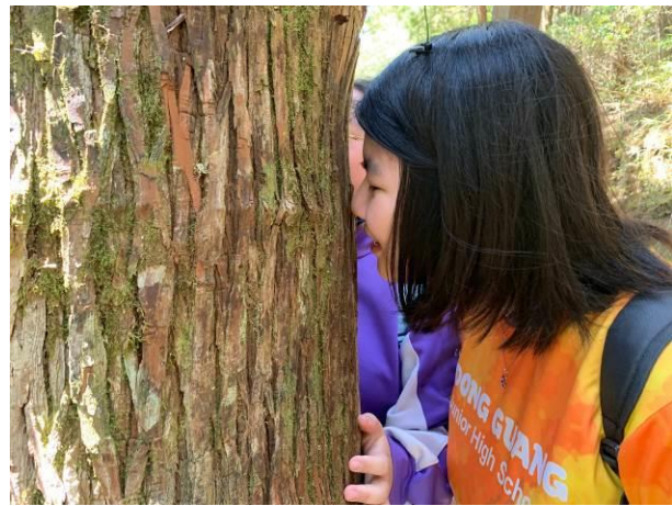
說明：透過五感（嗅覺），體驗大自然