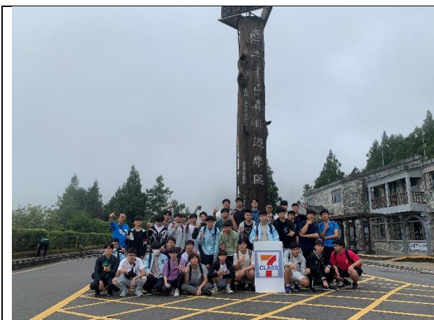
說明：宜蘭高中申請優質戶外教育路線