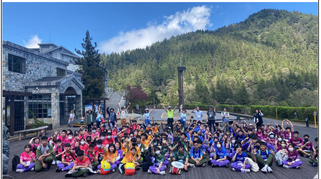
說明：師生參與「悠遊太平山」路線，全校八年級師生共 172 人參加，當天風和日麗，師生共遊太平，透過學習任務的安排，實地踏查太平詩路、搭乘蹦蹦車拜訪茂興步道。