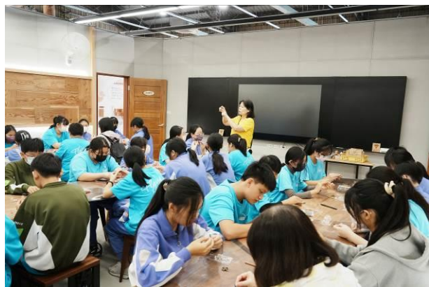
說明：國有林木飾品DIY