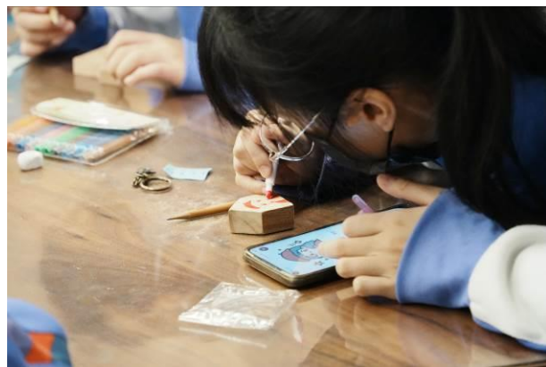
說明：國有林木飾品DIY