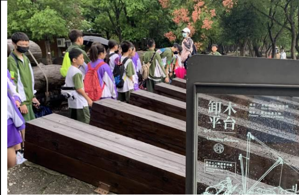
說明：導師介紹卸木平台