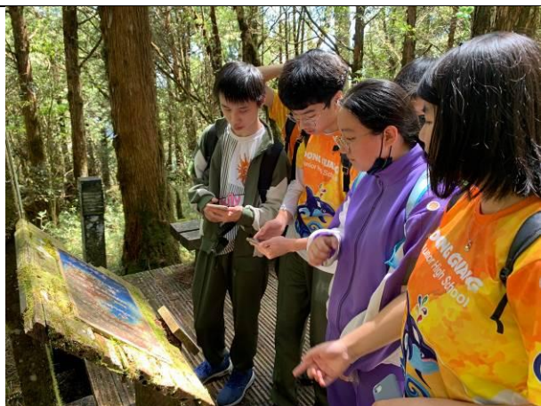
說明：太平詩路-與詩人對話