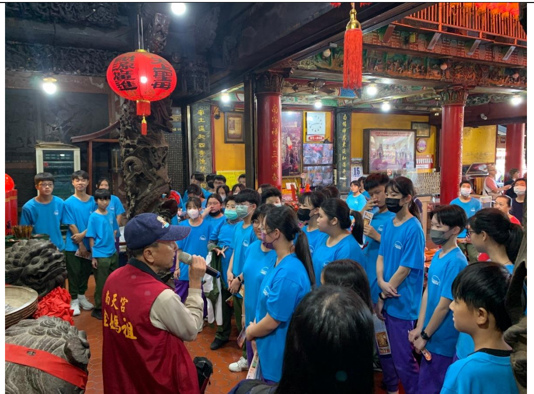
說明：師生參與「南方澳搜神記」路線，因為南方澳為漁港，因此民眾信仰中心就是媽祖廟，在南天宮廟方的解說之下才瞭解金媽祖、玉媽祖的由來。