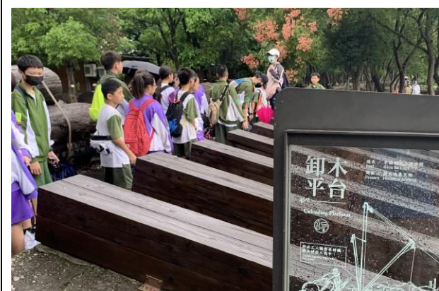
說明：老師介紹卸木平台的功用