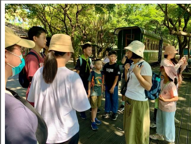
說明：老師導覽介紹羅東林場的歷史

(2) 詩文創作：學生透過導覽及觀察羅東林場的人文歷史、自然生態等，自行創作新詩、攝影作品等。