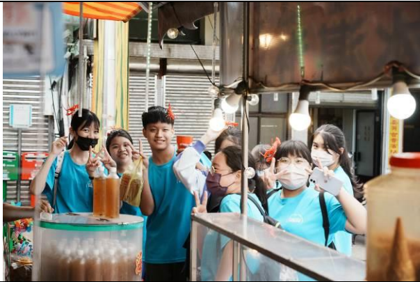
說明：走訪南方澳社區