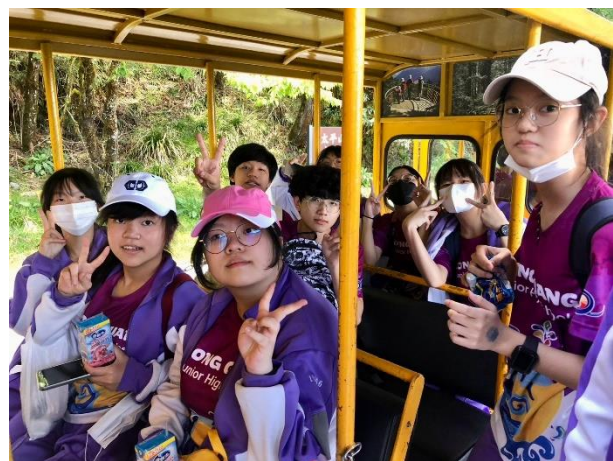
說明：搭乘蹦蹦車前往茂興古道