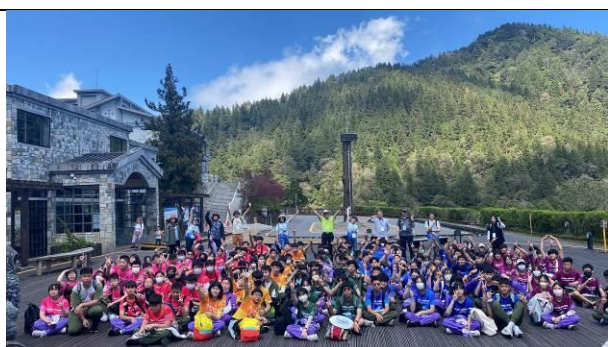
說明：全校八年級大合照