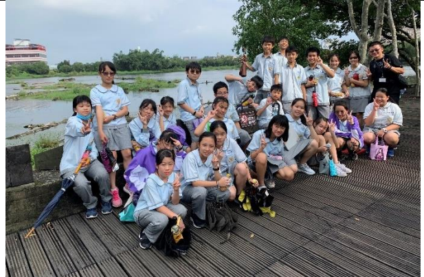
說明：儲木池畔全班合影