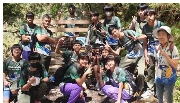
說明：我們走到步道終點