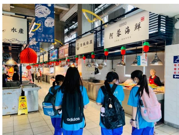
說明：走訪南方澳魚市場