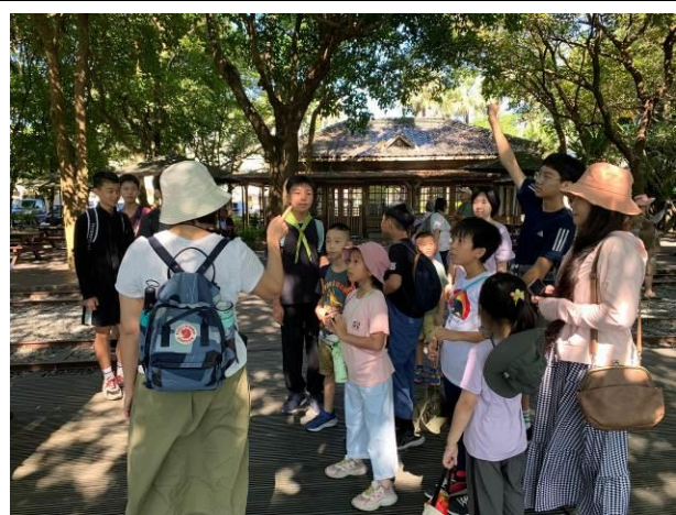
說明：師生互動與問答