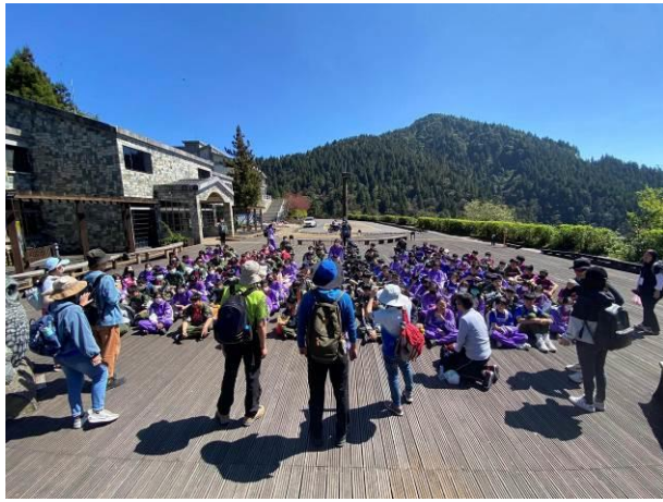
說明：準備進行太平山課程