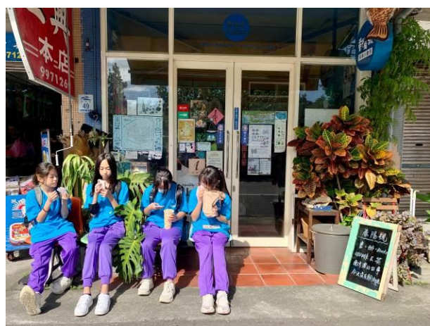
說明：走訪南方澳春陽號漁港小書房