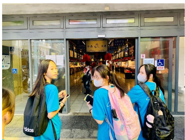
說明：走訪南方澳魚市場