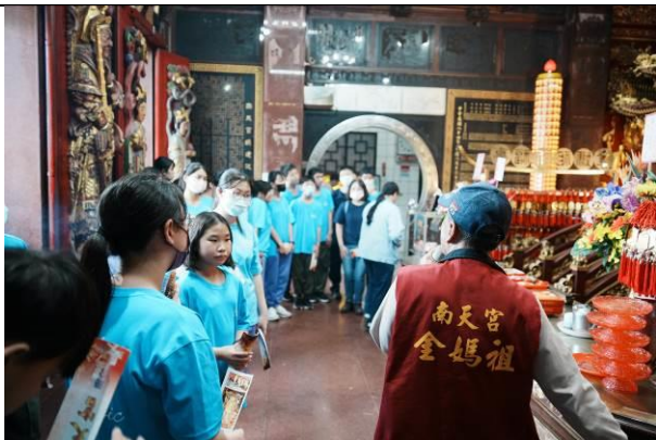
說明：南天宮志工介紹金媽祖的由來