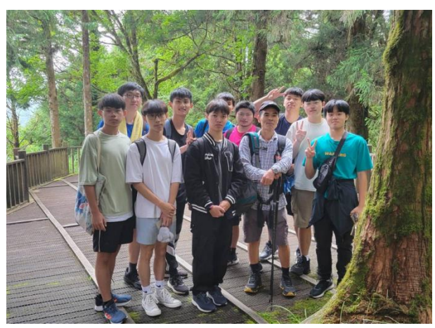
說明：跟到訪太平山的旅人互動合影