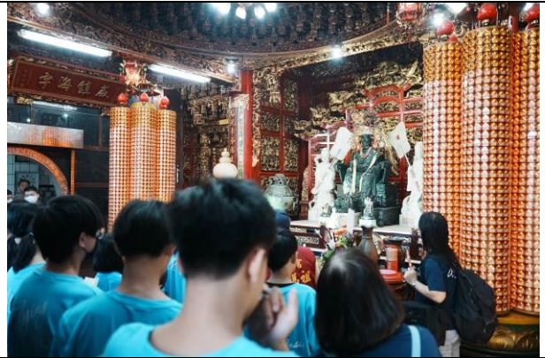
說明：南天宮志工介紹玉媽祖的由來