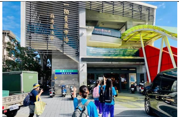
說明：走訪南方澳魚市場