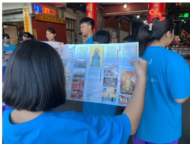
說明：南天宮導覽介紹