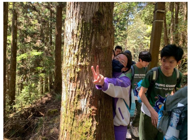
說明：透過五感（觸覺），體驗大自然