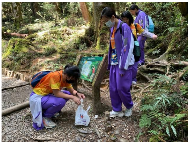
說明：無痕山林，自己的垃圾自己帶下山，順手把山上的垃圾一起帶下山