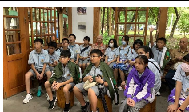
說明：學生認真聽老師介紹