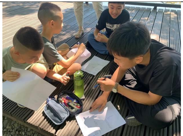
說明：詩文創作與討論