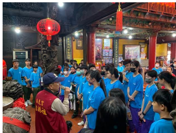
說明：南天宮廟方安排導覽解說介紹