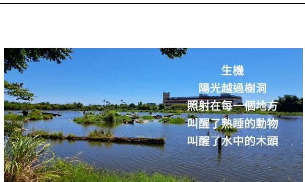
說明：走讀羅東學生作品