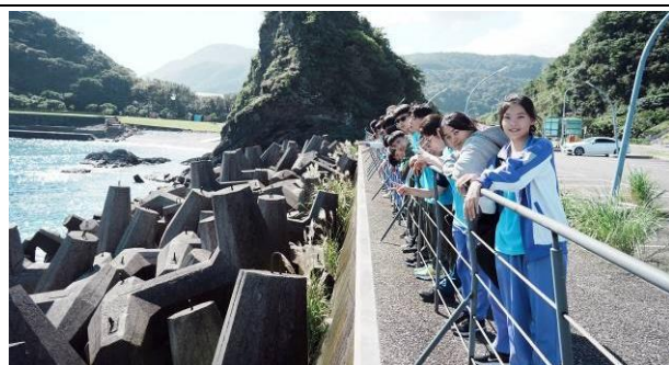
說明：豆腐舢風景區觀海