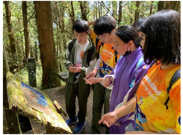
說明：探訪太平詩路