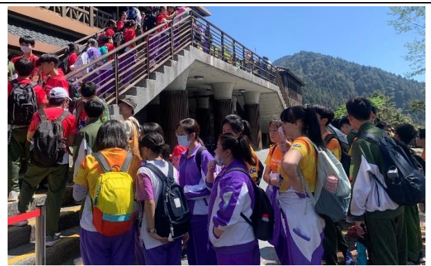
說明：排隊準備搭乘蹦蹦車