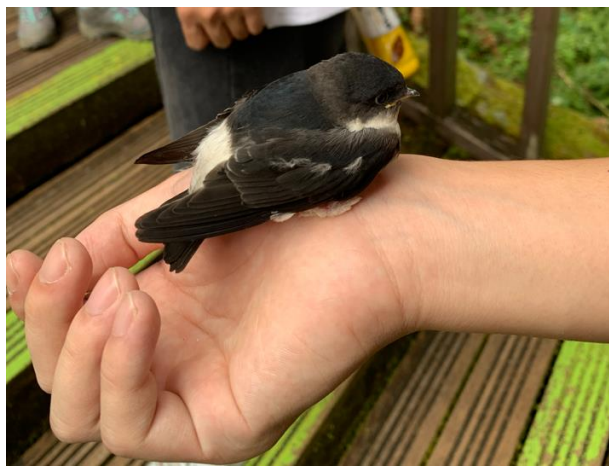
說明：拾獲掉落的燕子雛鳥