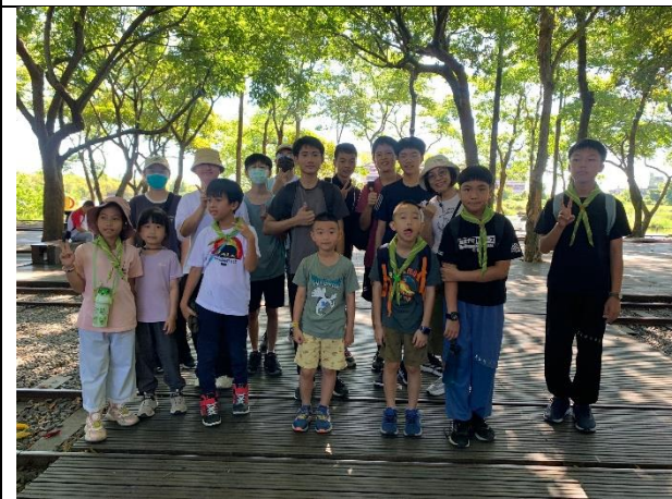
說明：大小同學合影