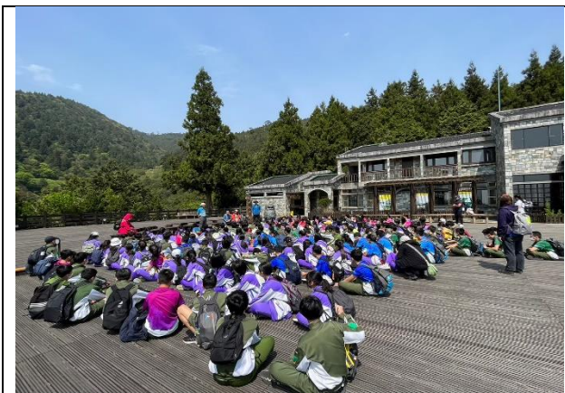
說明：校長分享上太平山的用意