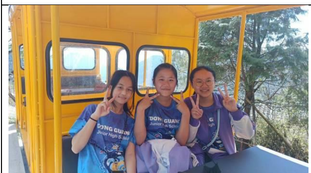
說明：搭乘蹦蹦車體驗