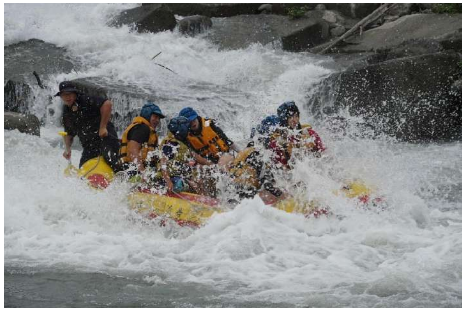
泛舟前大合照及泛舟中