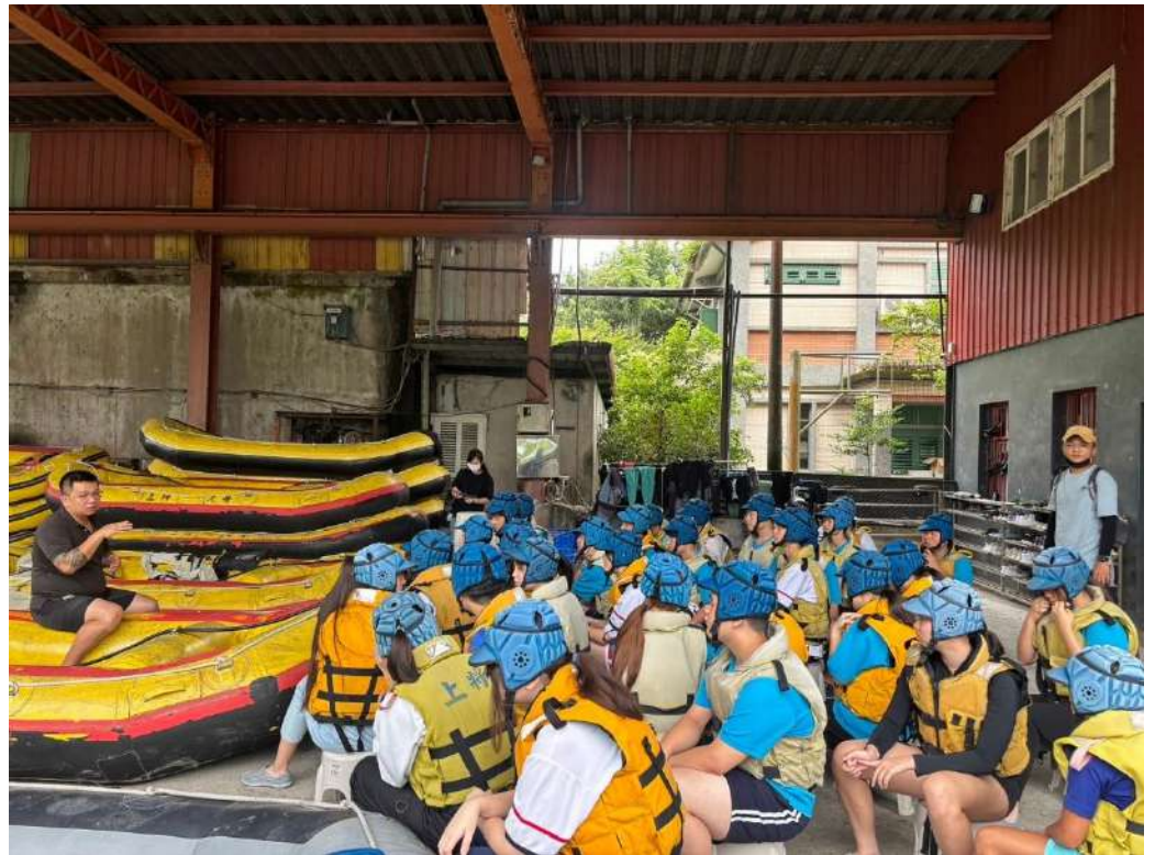
水域活動行前說明加強安全教育