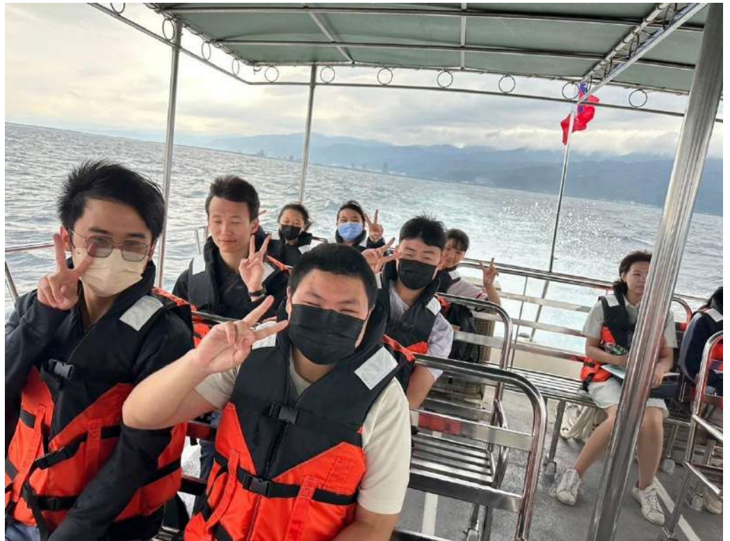
搭船前大合照及搭船中