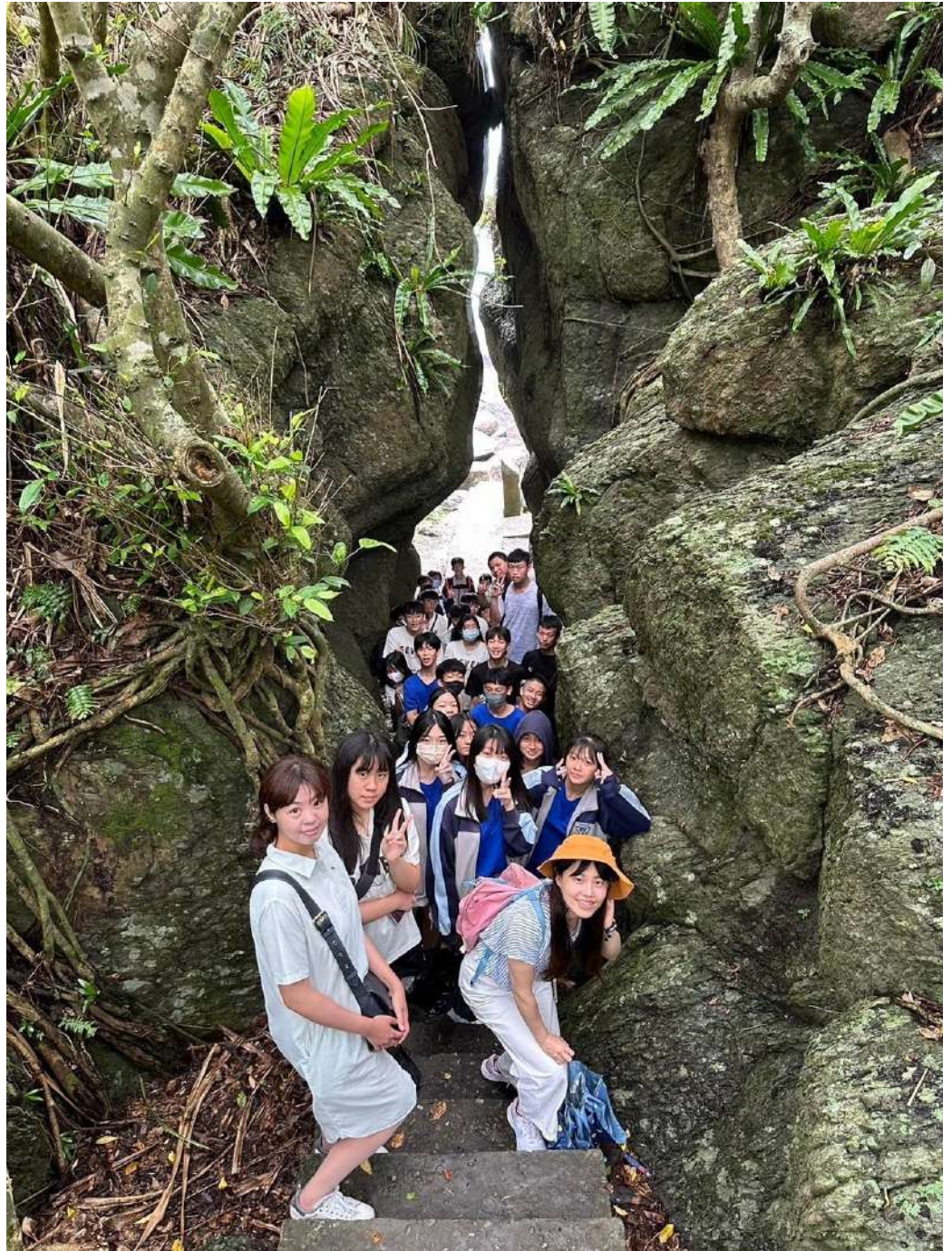
北關海潮公園一線天