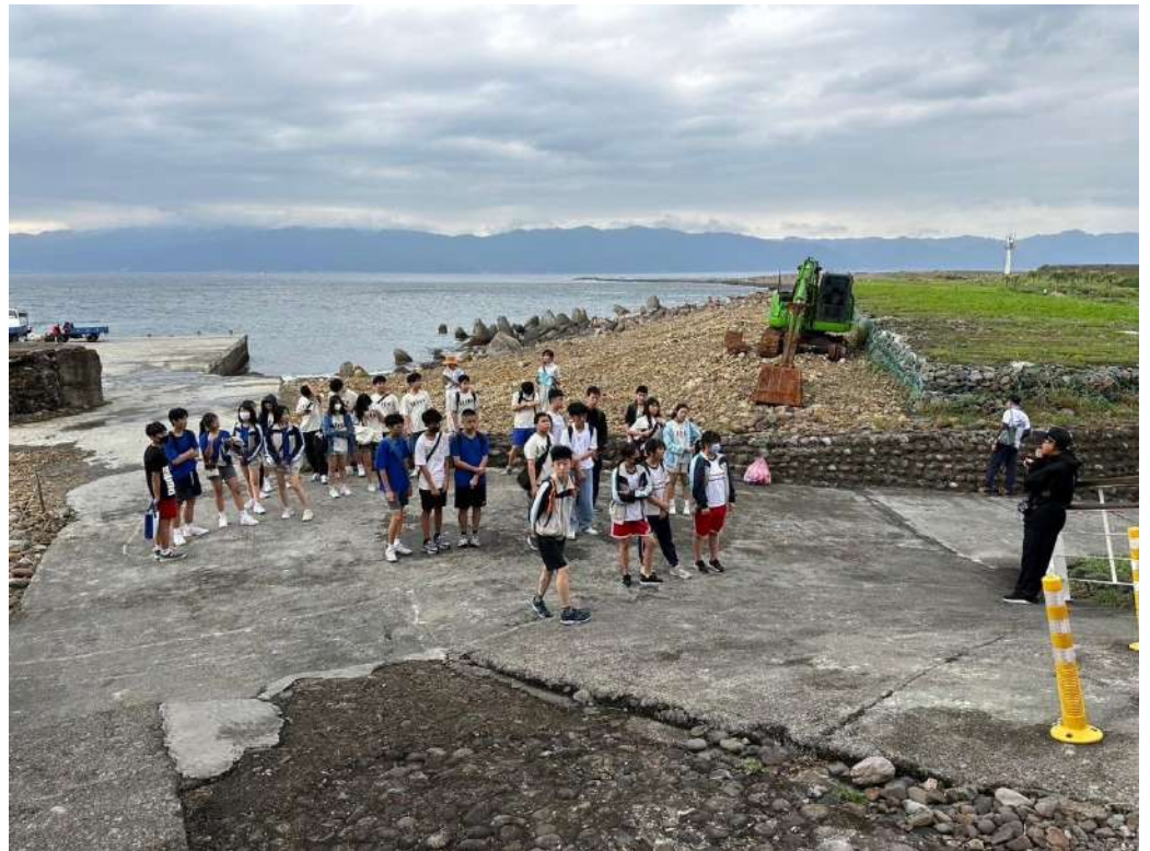
龜山島上巡禮 (另有繞島)