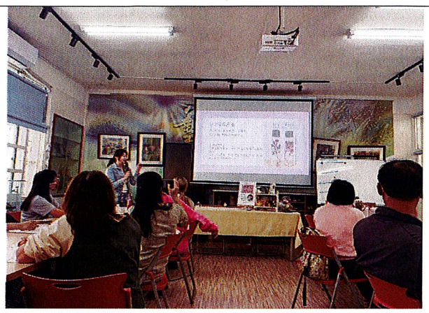
浮游即景：說明主題並引導學員如何資源永續再利用等議題。