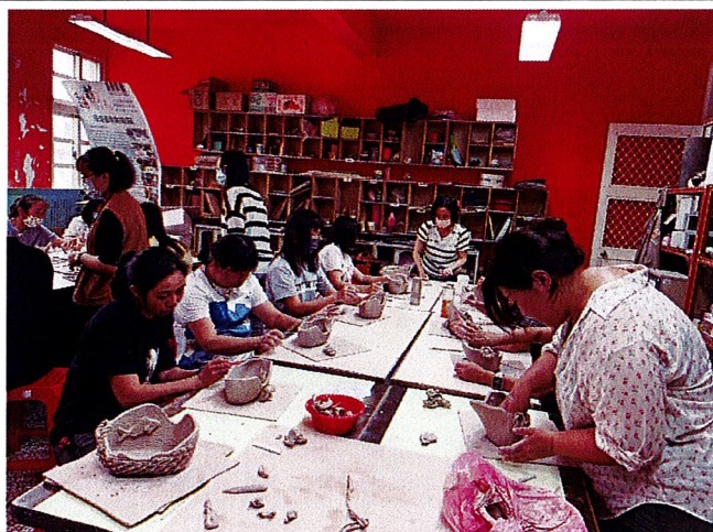
龜漁情~在長方形陶板上加上紋路或文字等裝飾。