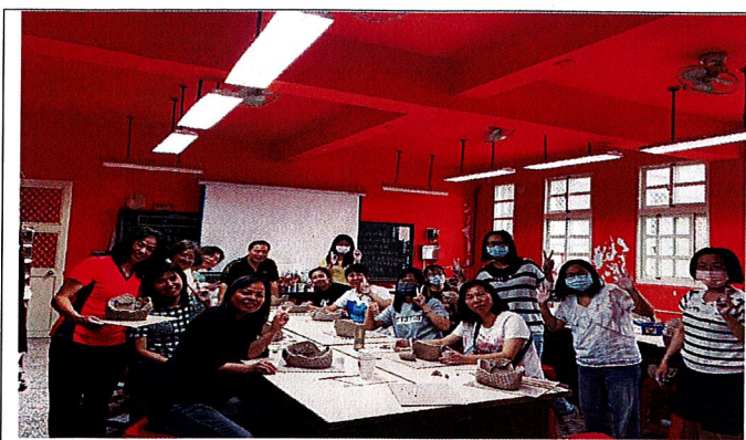
龜漁情~學員開心辛苦完成之展示作品。