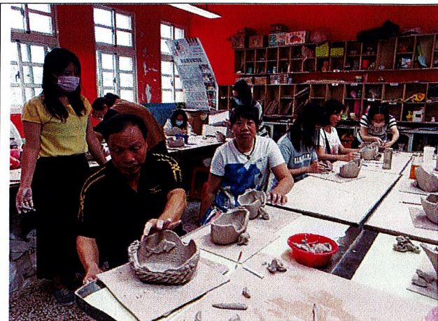
龜漁情~講師解說製作龜山型體之技巧。