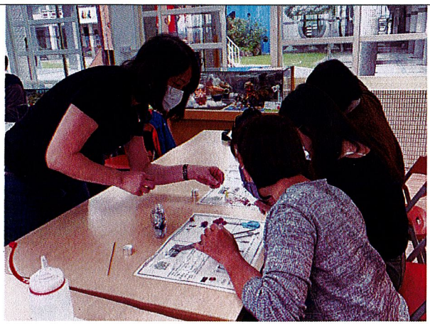
浮游即景：講師講解如何利用乾燥植物放入瓶中。