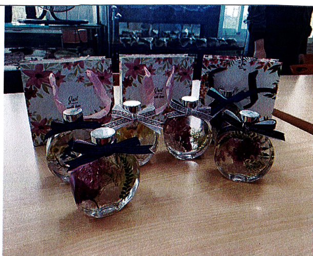
浮游即景：完成後之作品。