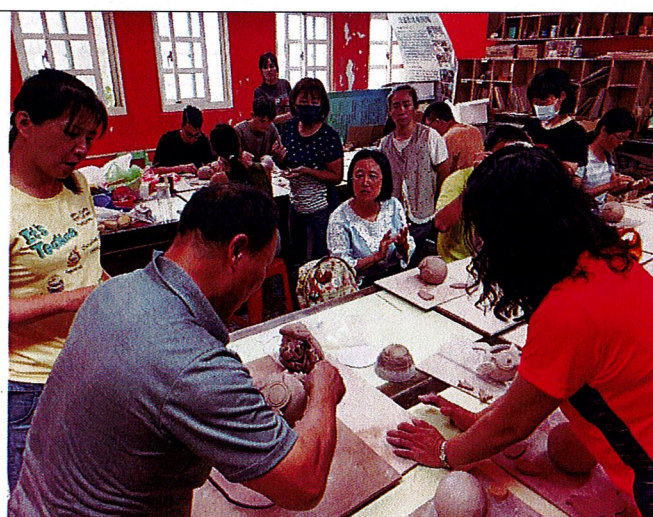
山中之寶~講師說明眼睛及嘴部做法