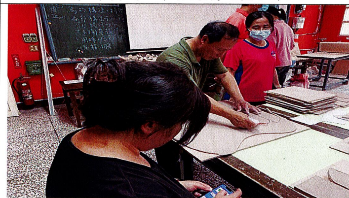
漁舟之樂~講師說明用紙版裁切出各部位。