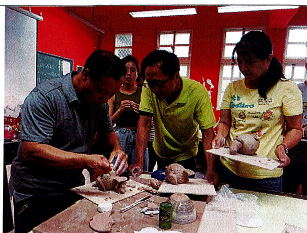
山中之寶~講師提醒學員結合尾巴、眼睛與腳之重點。