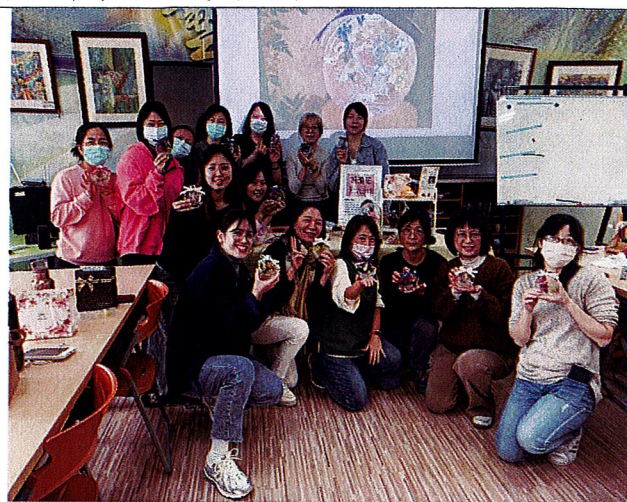
浮游即景：學員開心辛苦完成之展示作品。