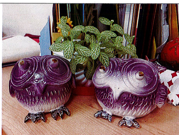
山中之寶~釉燒後之作品。