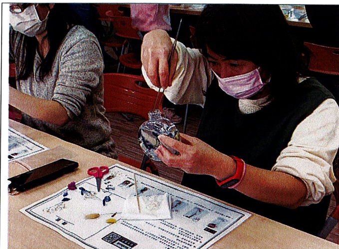
浮游即景：學員依講師說明開始組合。