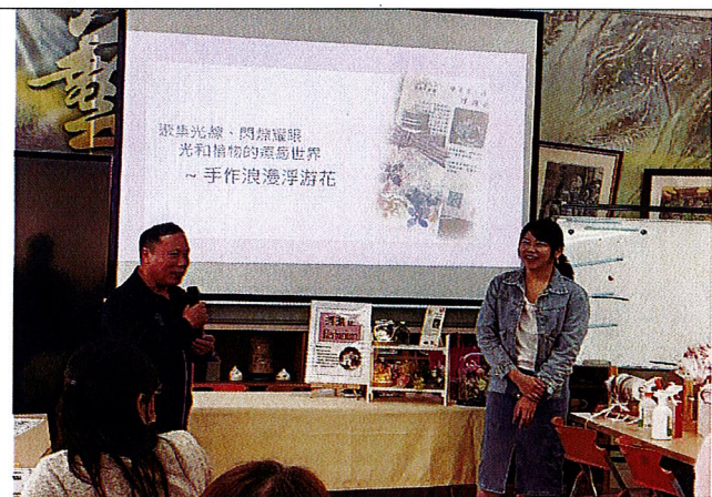
浮游即景：說明主題並引導學員環境保護的重要性。