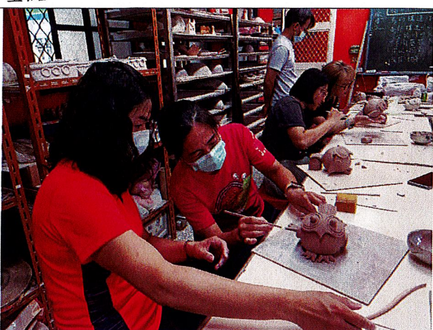
山中之寶~學員們認真做出漂亮的作品。