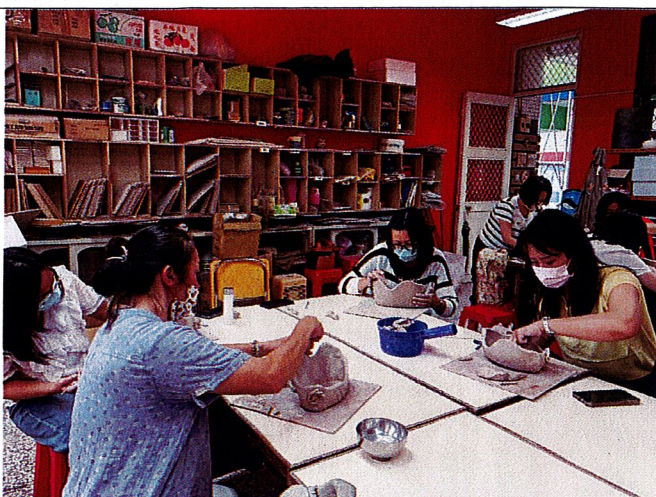
龜漁情~學員專注的創作獨一無二作品。