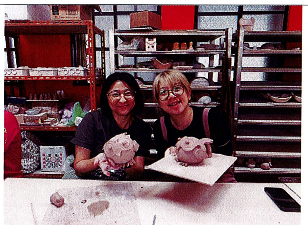
山中之寶~最後，與自己的作品來張合照