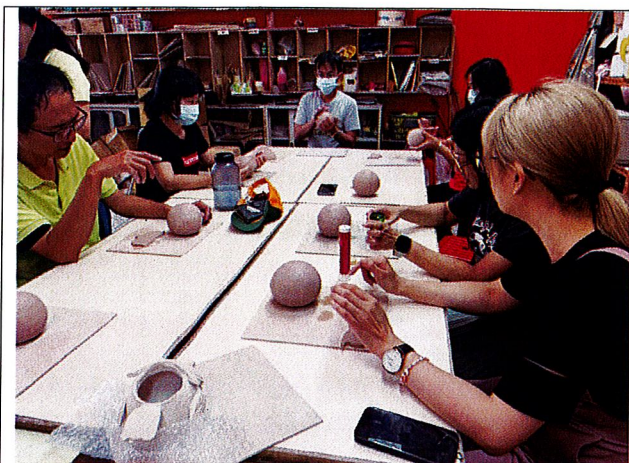
山中之寶~學生依講師說明認真製作屬於自己風格之貓頭鷹。