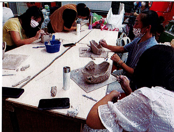
龜漁情~學員開始將在陶板以畫上或有泥條做出漁網。