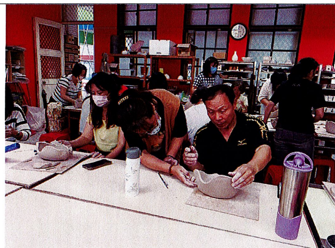
龜漁情~講師提醒製作時易犯之錯誤。