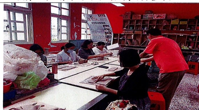
漁舟之樂~學員將陶版組合成漁舟。