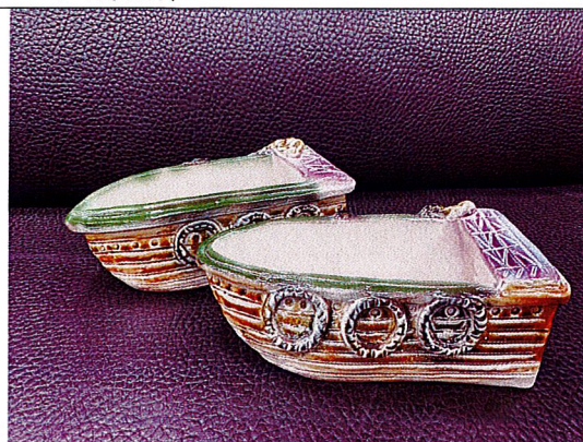
漁舟之樂~釉燒後之成品。