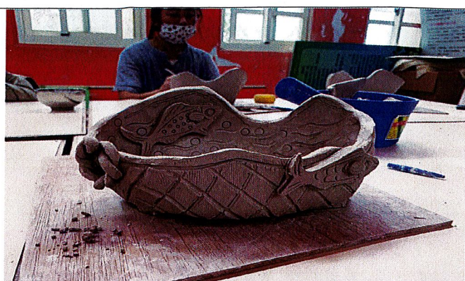
龜漁情~完成作品(泥胚)