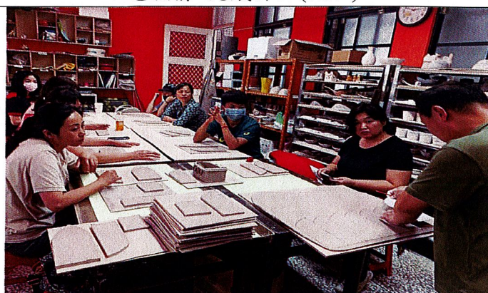
漁舟之樂~漁舟的各部位。