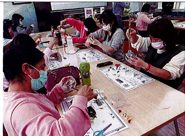
浮游即景：學員在瓶中放入自己心目中的乾燥植物。