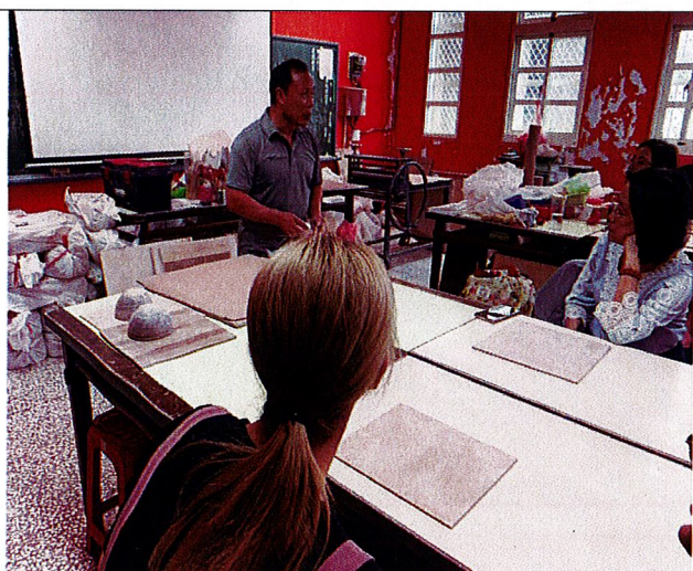
山中之寶~講師說明貓頭鷹的特徵與製作要點