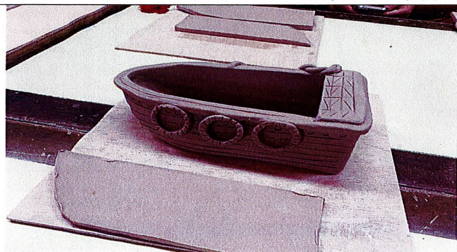
漁舟之樂~完成作品(泥胚)。