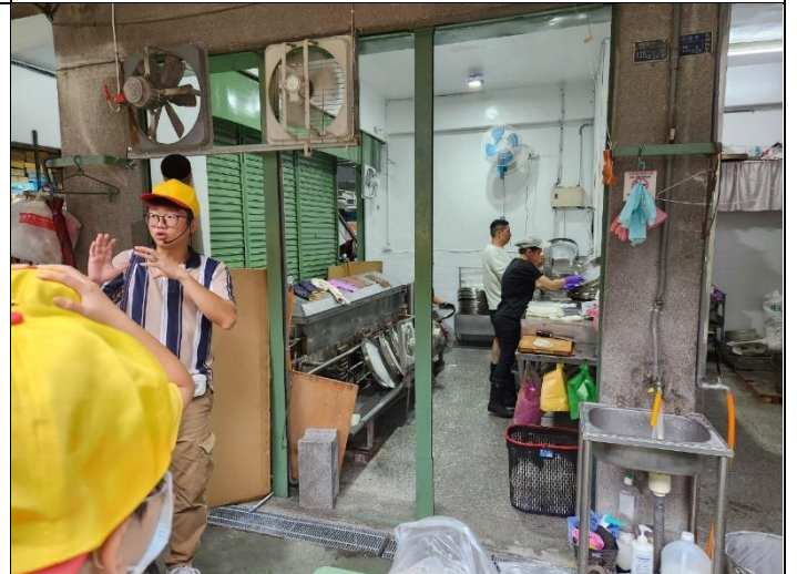
說明：市場遊學~老師帶學生瀏覽南館市場中特色攤位，除了用眼睛看還能親自品嚐最新鮮的口感。