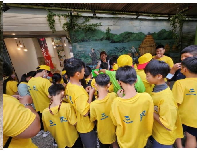
說明：下午來到了冬山鄉的良食農創園區，老師介紹米的處理過程，讓學生用五感進行體驗