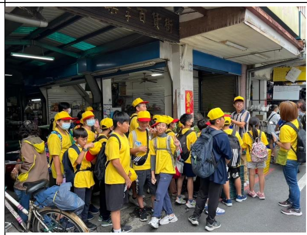
說明：介紹北館市場的草藥鋪及老店興衰