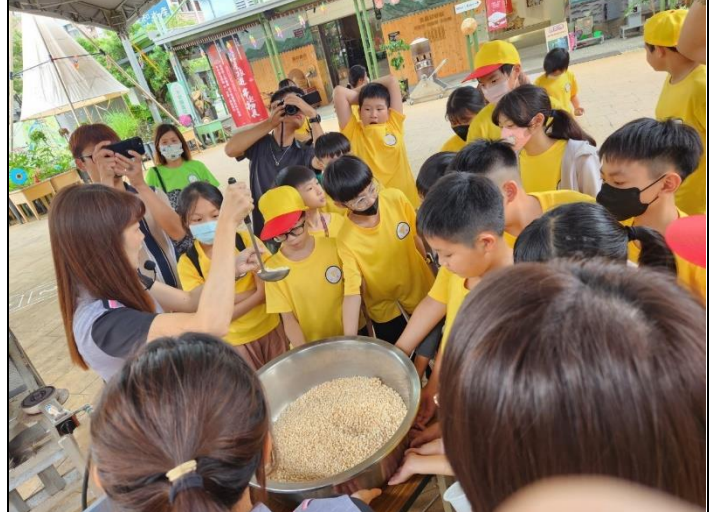
說明：加碼的爆米香活動，聽覺與味覺的體驗