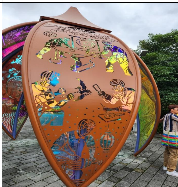
說明：就從九芎的百工意象裝置說起宜蘭市場的發展