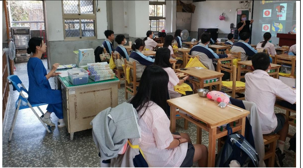
返校後依據先前主體設計進行報告，小組成員討論並分享。