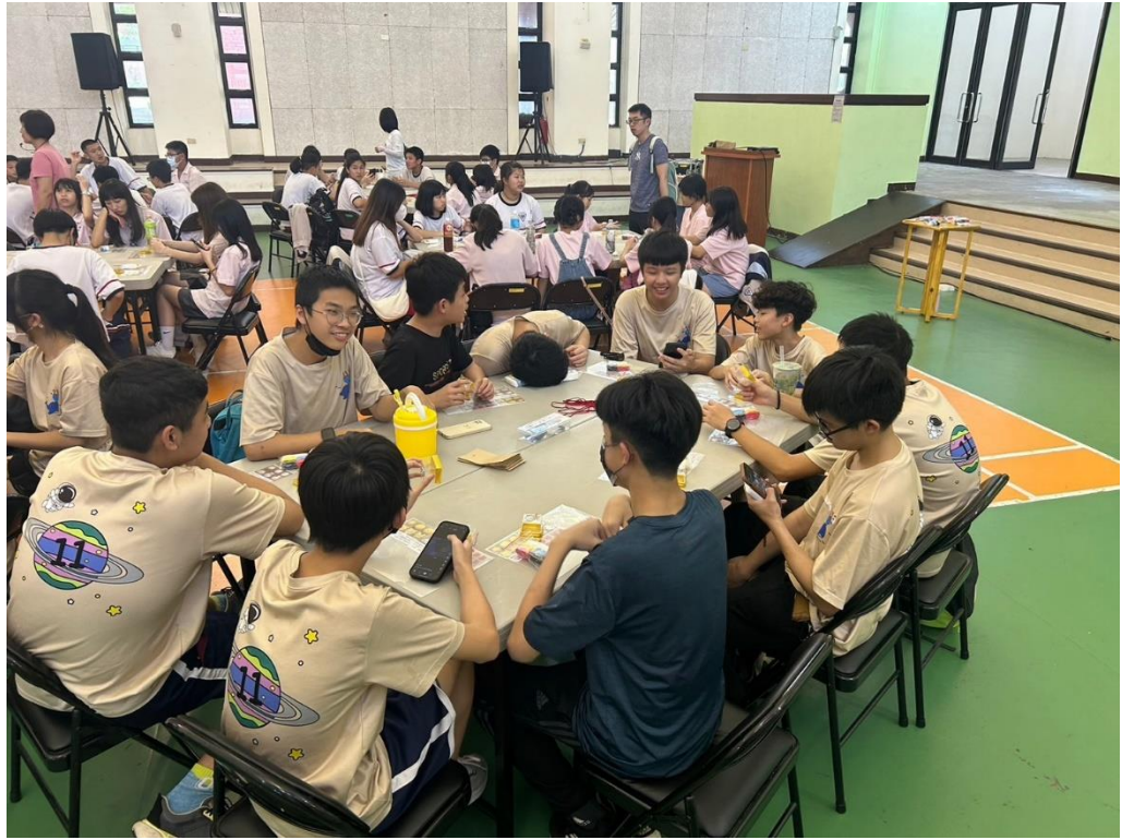
手作體驗動手製作屬於自己和傳藝的回憶。