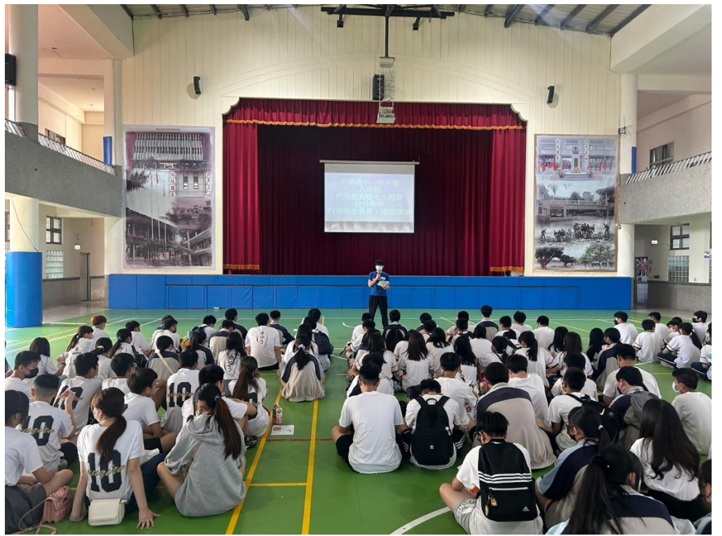
出發當日進行交通安全宣導及乘車禮儀