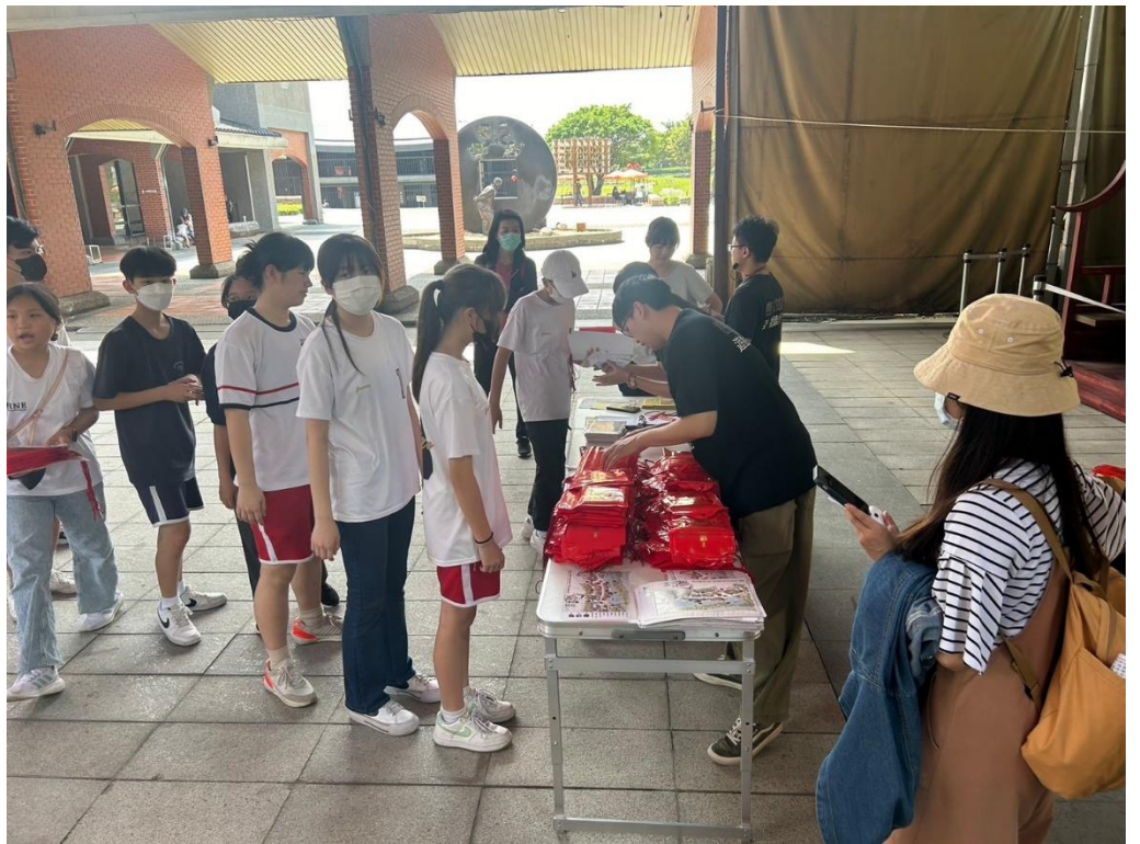
毛筆頭的集墨旅行在園區進行闖關活動。