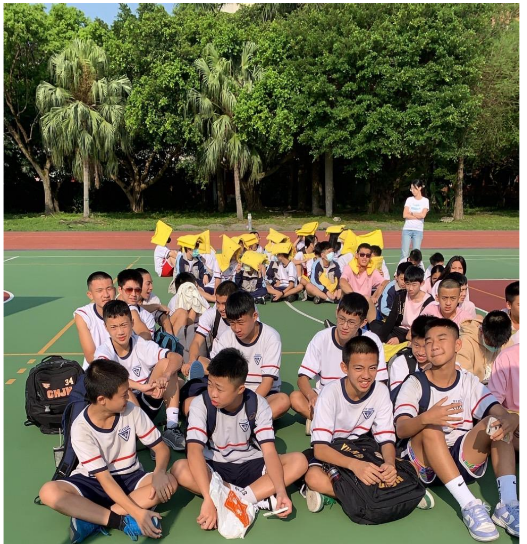
集合時適逢0403大地震，隨即進行防災逃生