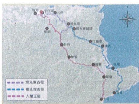
淡蘭古道北路地圖，官方整理出的三條路徑：