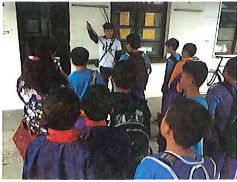
釣魚體驗注意事項說明