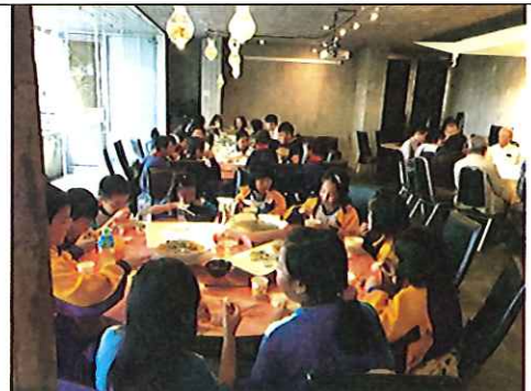
體驗水草餐廳精心製作的水草餐