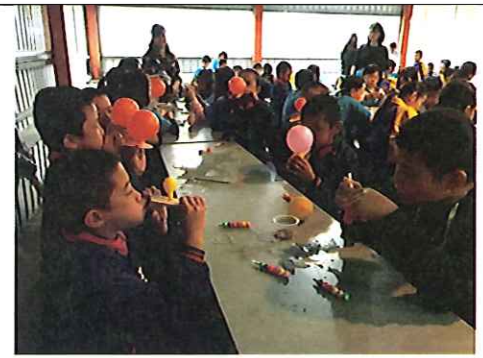
氣球遊艇彩繪製作