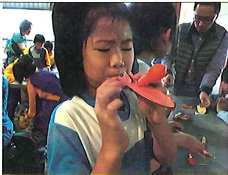
氣球遊艇彩繪製作