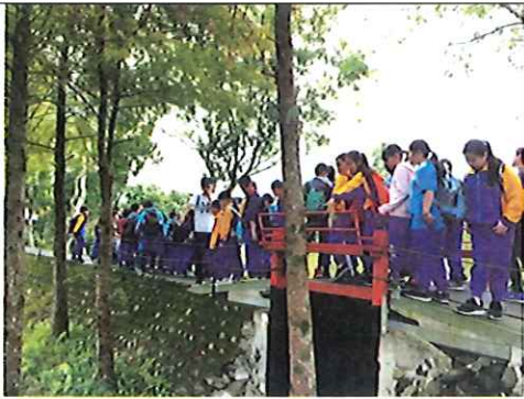
園區植物導覽，令學生印象深刻