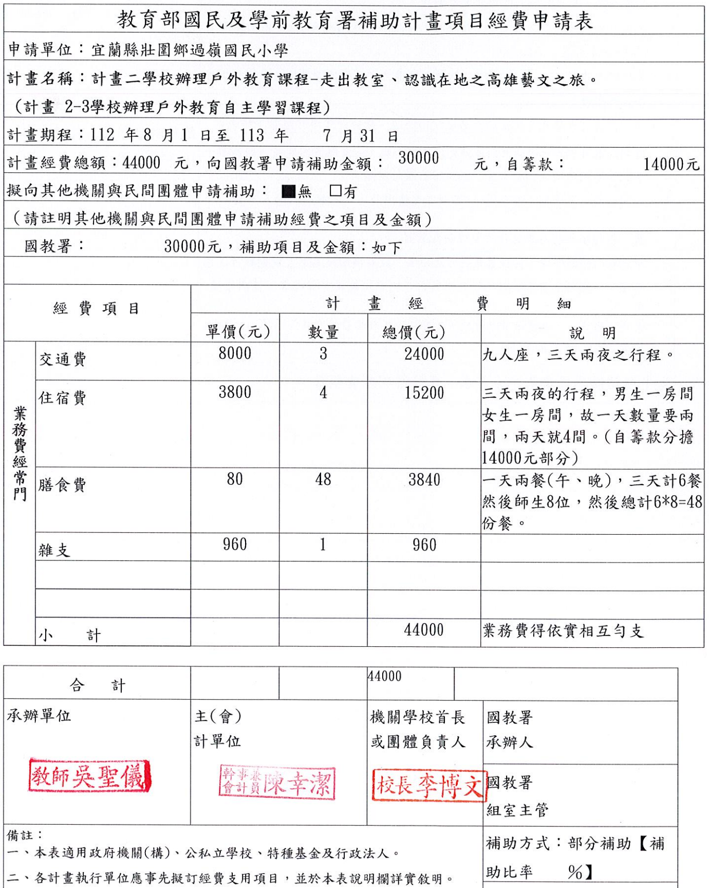
表 4 計畫二、辦理戶外教育課程經費申請表-學校填列提報