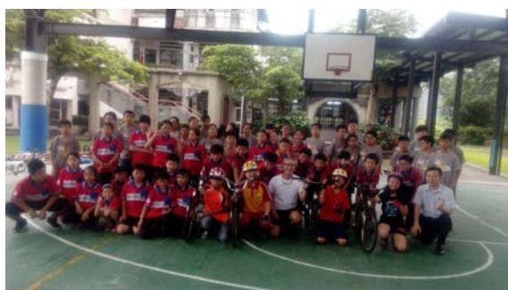
羅東國小到體會越野自行車

經過這次活動，也希望其他學校也能有機會進行校際之間的互訪，因為學生對自己家鄉可能很了解，但是對別地區了解並不是非常多，也很感謝縣府推出這計畫，讓大湖國小學生能和羅東國小做校際之間的交流活動。