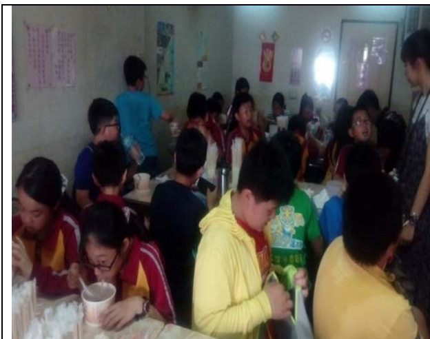
羅東林場肉羹是羅東地區最多人想去品嚐的美食