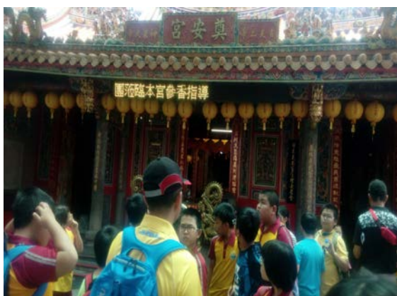
奠安宮是羅東地區重要廟宇之一，主要祭祀神農大帝