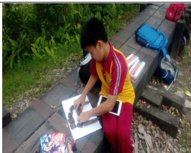
利用羅東林場的石頭木屑葉子嘗試去把今天參觀的景物拼湊出來成為一個美術作品