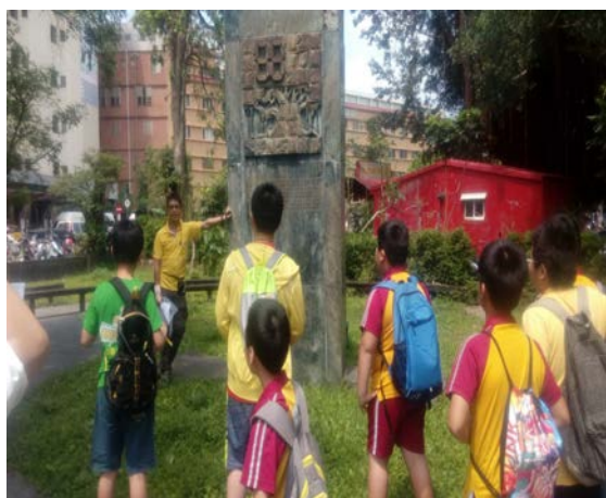
楊英風尊親精神堡壘是羅東國小重要的地標之一，楊英風也是國內重要雕刻家朱銘的老師