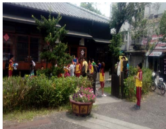
成功國小校長及老師舊宿舍也是宜蘭縣重要日本時代建築物之一