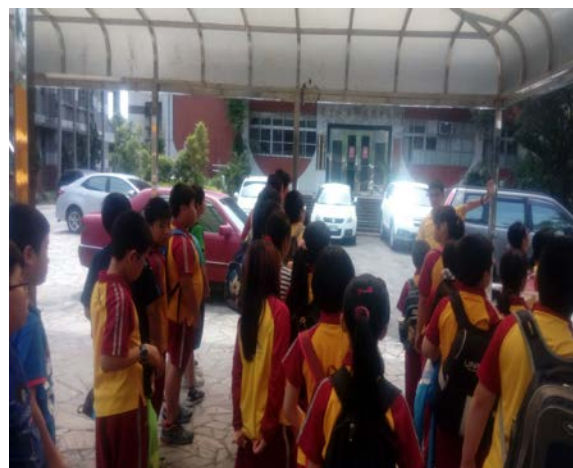
科學教育中心是羅東國小重要的地方，也是縣內推展科學中心的重要據點