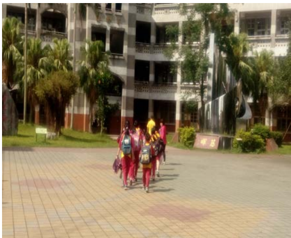
用愉快的心情踏進羅東國小校園