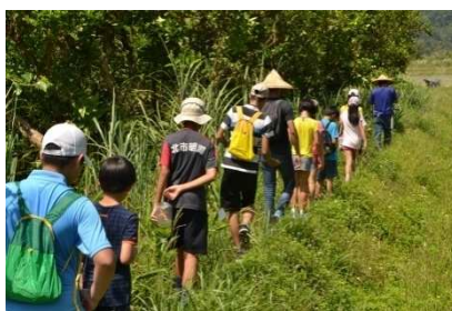
探訪龜將軍的腳印~湖埤行