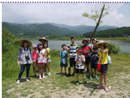
探訪龜將軍的腳印~湖埤行