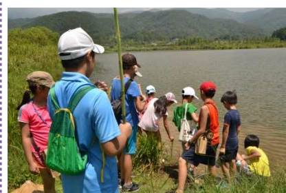
探訪龜將軍的腳印~湖埤行