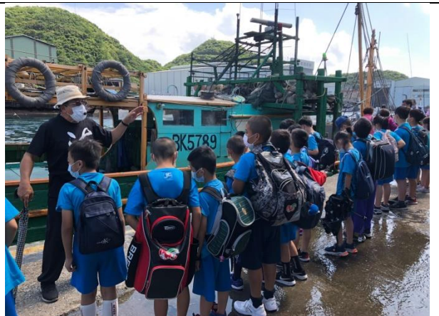
說明：走讀第一漁港週邊。