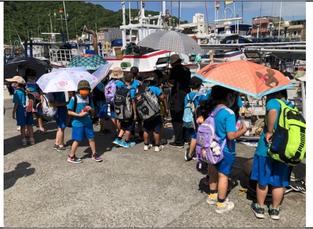
說明：走讀第一漁港週邊。