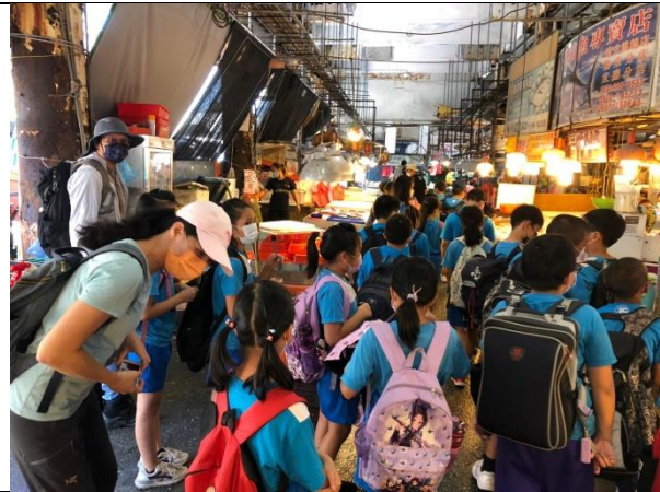
說明：實地觀察南寧漁市場漁獲買賣。