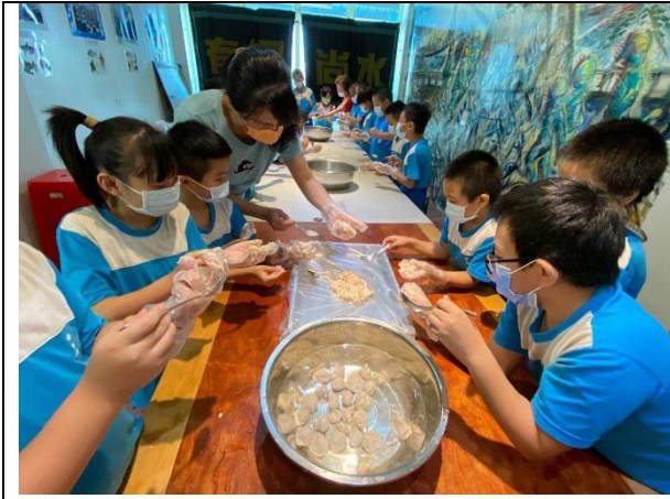
說明：老師指導學生動手製作飛虎魚丸。