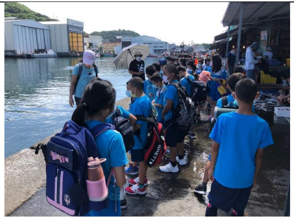
說明：走讀南寧漁市場。