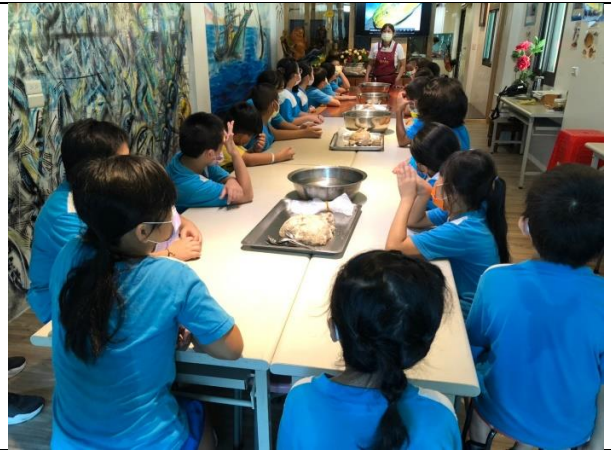
說明：南方澳魚獲及魚種簡介。