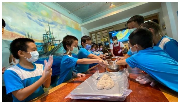
說明：學生動手製作飛虎魚丸。