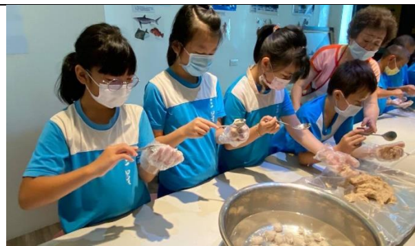
說明：學生動手製作飛虎魚丸。