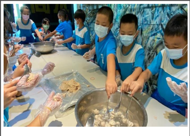
說明：學生動手製作飛虎魚丸。