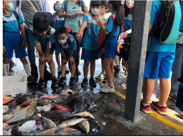
說明：走讀南寧漁市場。