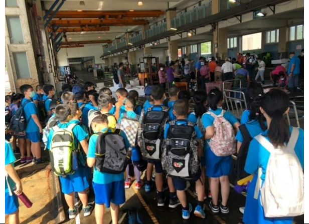
說明：觀摩拍賣市場運作。