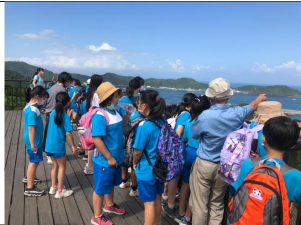
說明：觀景臺俯瞰南方澳地形全景。