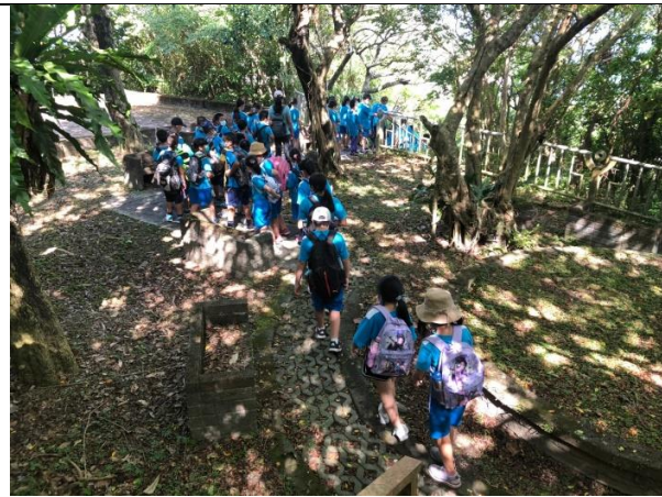
說明：觀景臺平台往下到內埤海灣步道巡禮 ※不足列請自行新增。