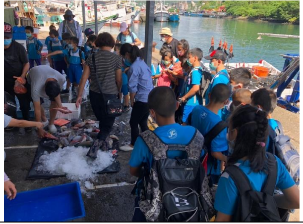
說明：實地觀察南寧漁市場漁獲買賣。