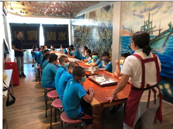
說明：飛虎魚丸製作講解。