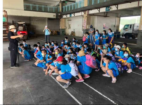
說明：第一拍賣市場導覽解說。