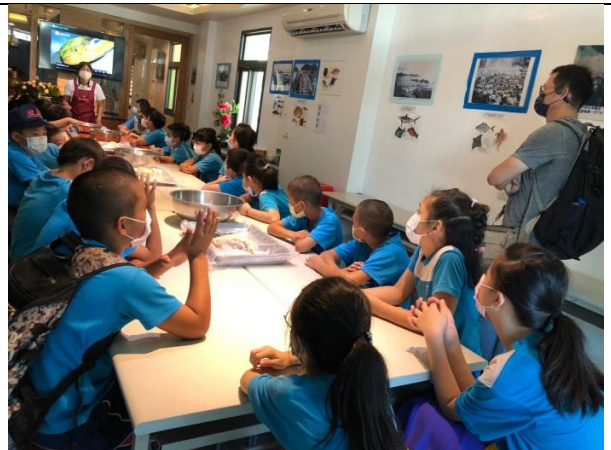
說明：飛虎魚丸製作講解。