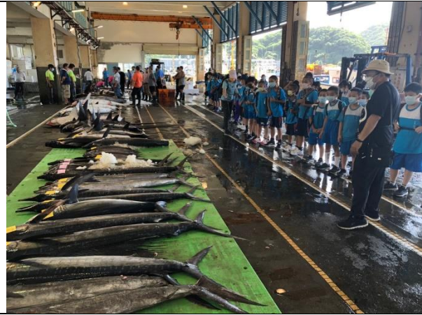
說明：認識拍賣市場漁獲。