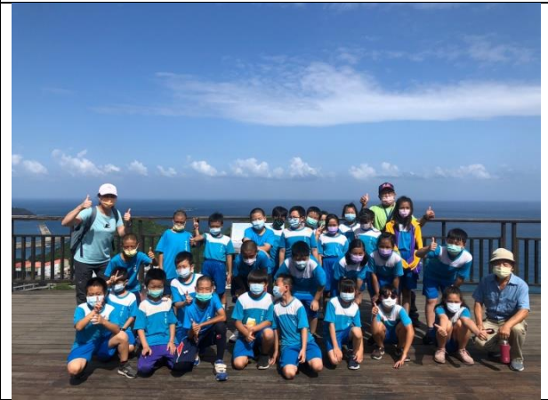
說明：觀景臺合影留念。