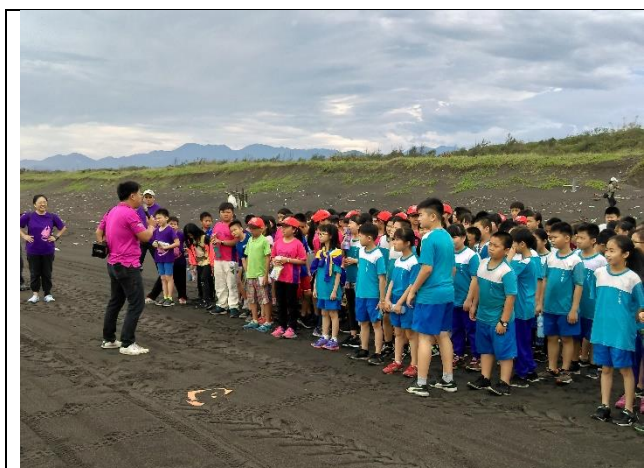
◆張總幹事解說牽罟的流程