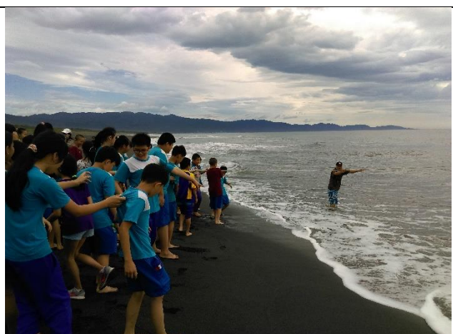
◆跟著耆老準備牽罟