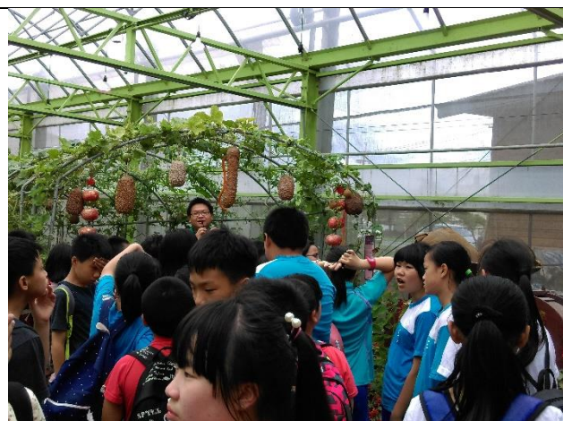
❖解說現代科技如何運用在農業栽培