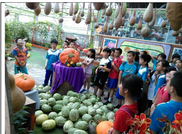
❖尋找傳說中的南瓜