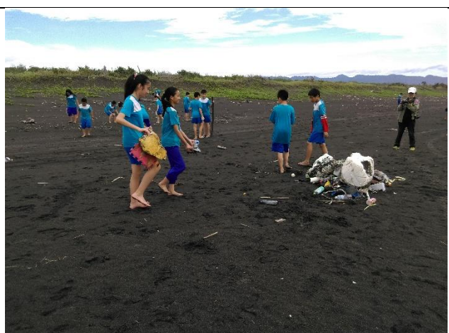
◆淨灘，留下淨美的海灘