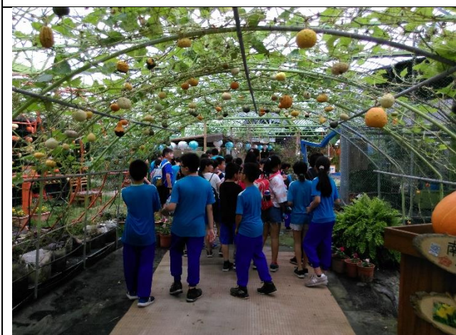
❖認識各種不同的瓜果