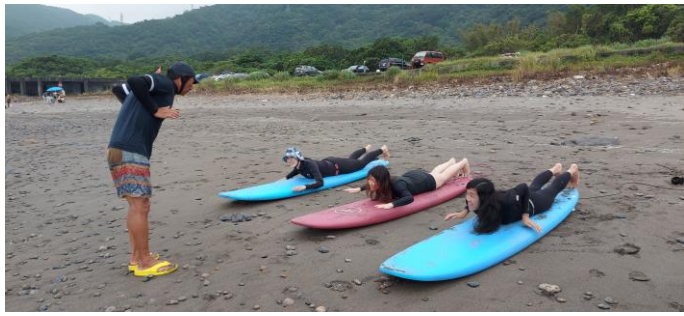
圖片說明：硬式衝浪學員陸上練習動作