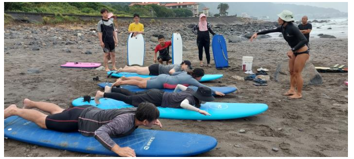
圖片說明：硬式衝浪學員陸上練習動作