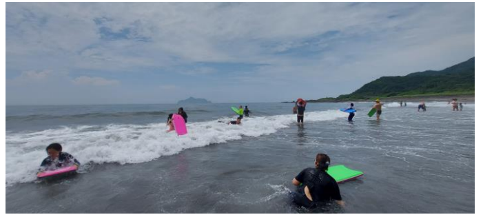
圖片說明：臥式衝浪衝浪情形