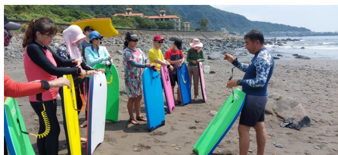
圖片說明：教練介紹衝浪板裝備