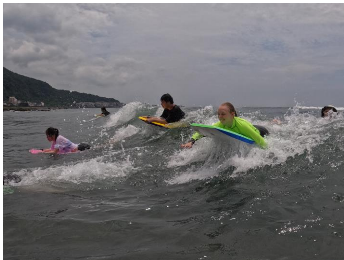
圖片說明：臥式衝浪衝浪情形