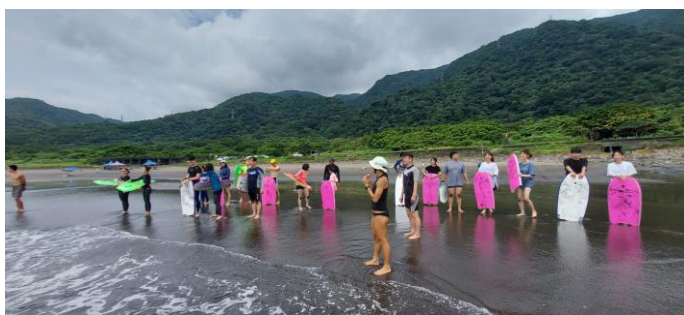
圖片說明：下水前情形