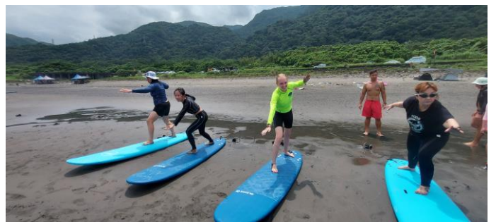
圖片說明：硬式衝浪學員陸上練習動作