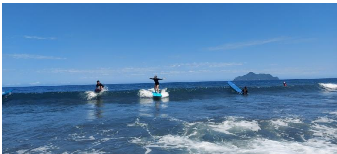
圖片說明：硬式衝浪板衝浪情形