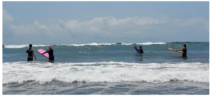
圖片說明：臥式衝浪衝浪情形