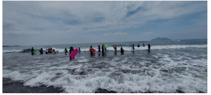
圖片說明：臥式衝浪衝浪情形