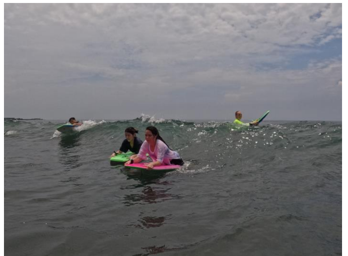
圖片說明：臥式衝浪衝浪情形