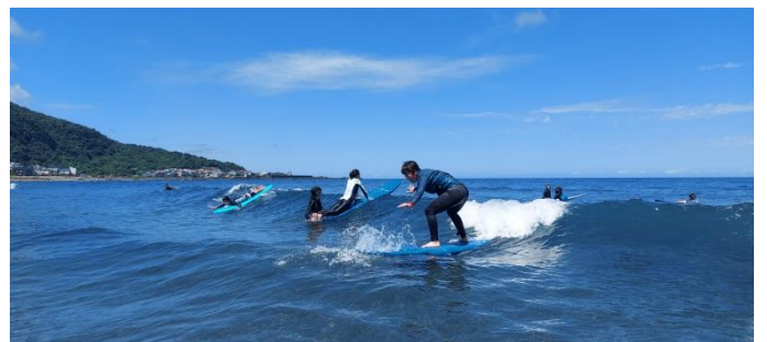
圖片說明：硬式衝浪板衝浪情形