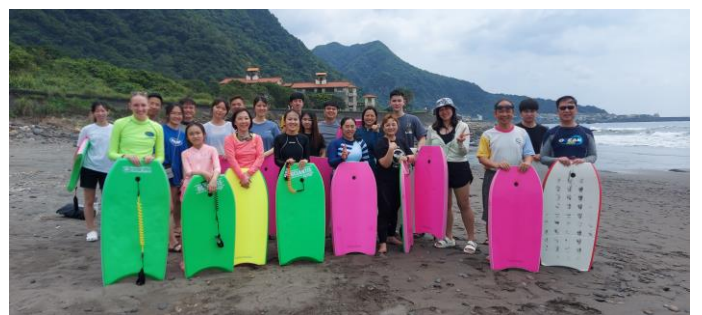
圖片說明：課程結束大合照