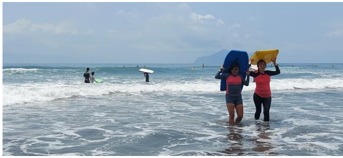
圖片說明：臥式衝浪衝浪情形