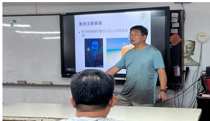
圖片說明：海洋運動簡介課程實施情形