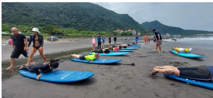
圖片說明：硬式衝浪學員陸上練習動作