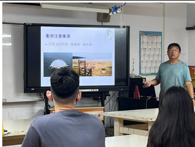
圖片說明：海洋運動簡介課程實施情形