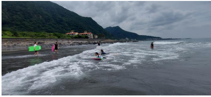
圖片說明：臥式衝浪衝浪情形