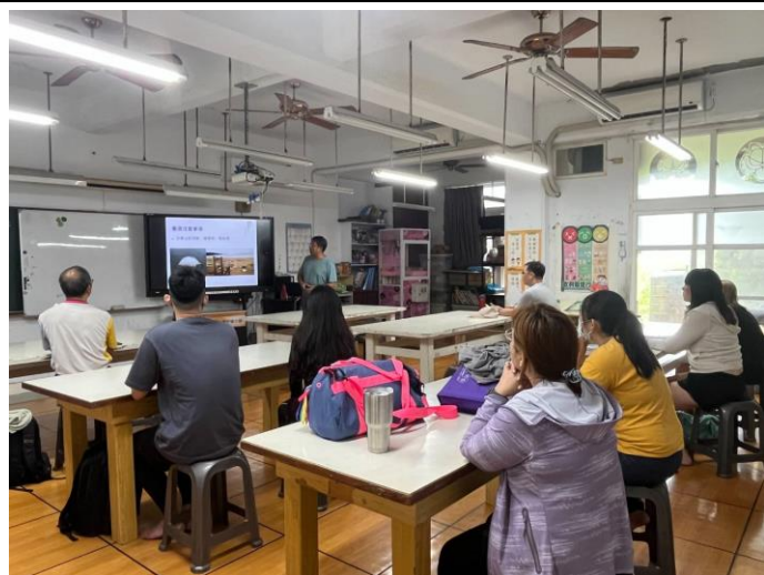
圖片說明：海洋運動簡介課程實施情形