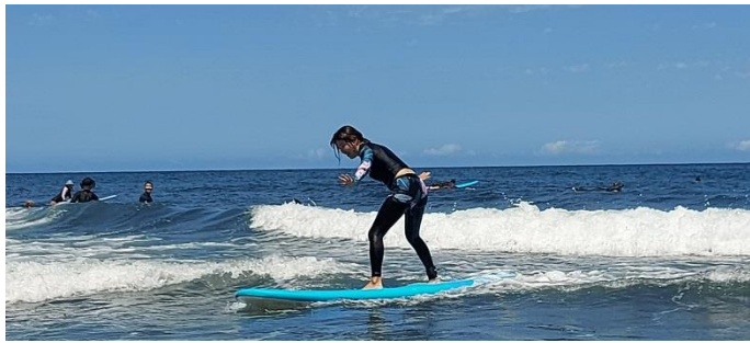
圖片說明：硬式衝浪板衝浪情形