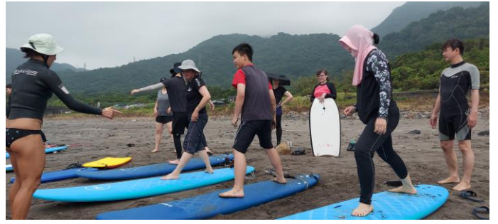
圖片說明：硬式衝浪學員陸上練習動作