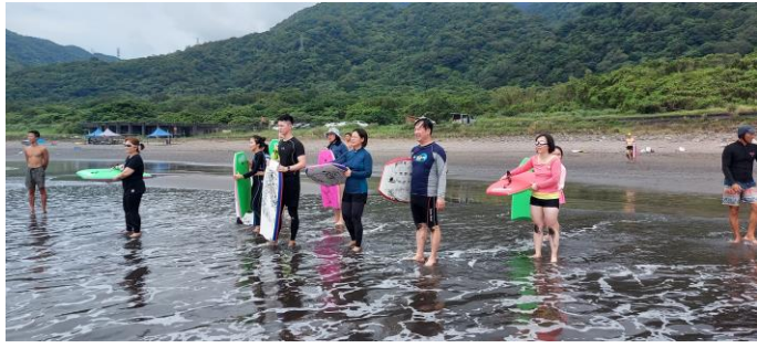
圖片說明：臥式衝浪衝浪情形