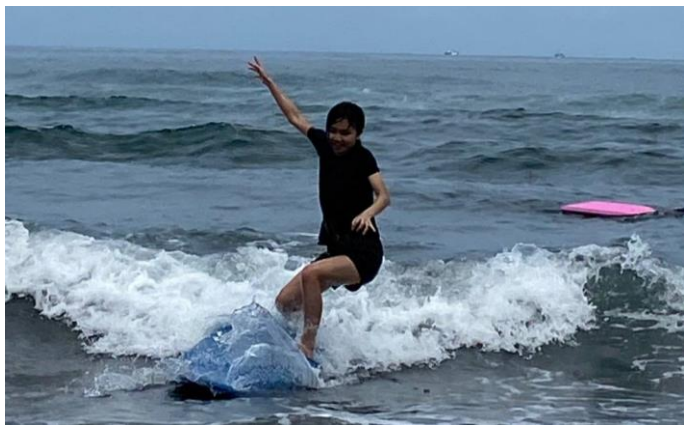
圖片說明：硬式衝浪板衝浪情形