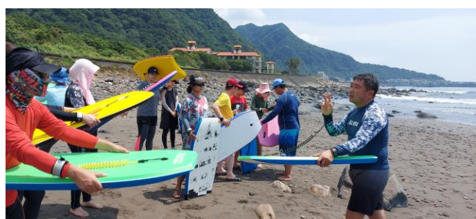
圖片說明：教練介紹衝浪板裝備