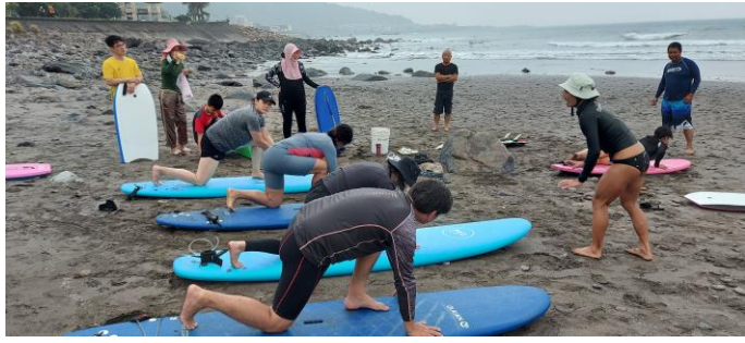
圖片說明：硬式衝浪學員陸上練習動作