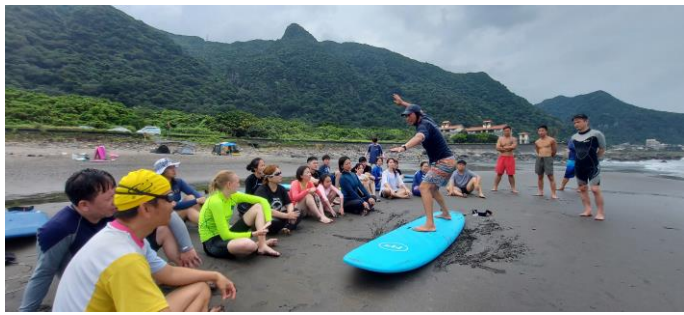
圖片說明：硬式衝浪教練示範動作