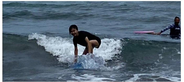
圖片說明：硬式衝浪板衝浪情形