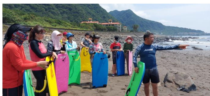
圖片說明：教練說明海上安全注意事項