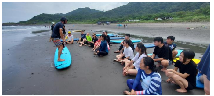
圖片說明：硬式衝浪教練示範動作