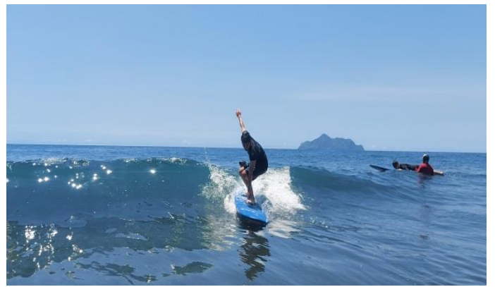
圖片說明：硬式衝浪板衝浪情形