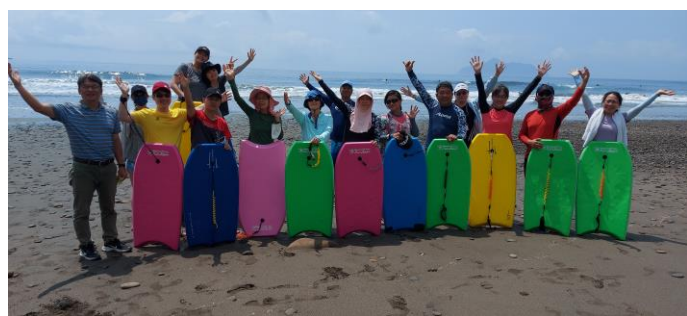
圖片說明：蜜月灣沙灘合照