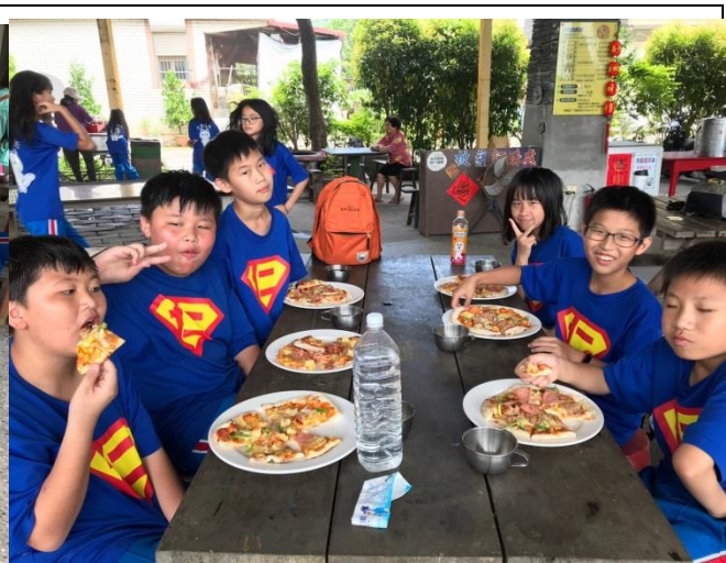
使用當地居民種植的農作物、品嚐自己製作的披薩