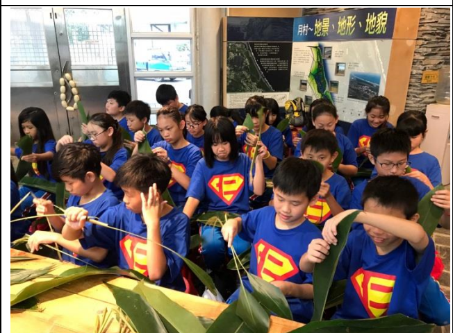
認識無尾港環境特色、了解社區居民如何和環境共存共榮