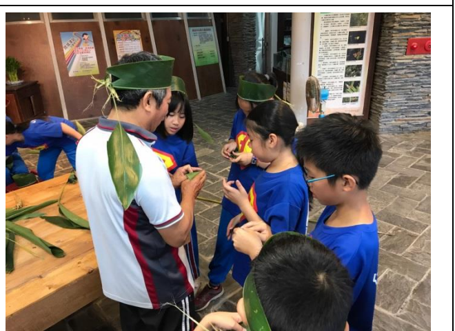
認識無尾港環境特色、了解社區居民如何和環境共存共榮