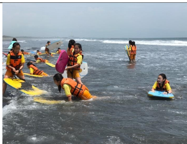
遵守安全規範穿著救生衣、享受海洋的美好