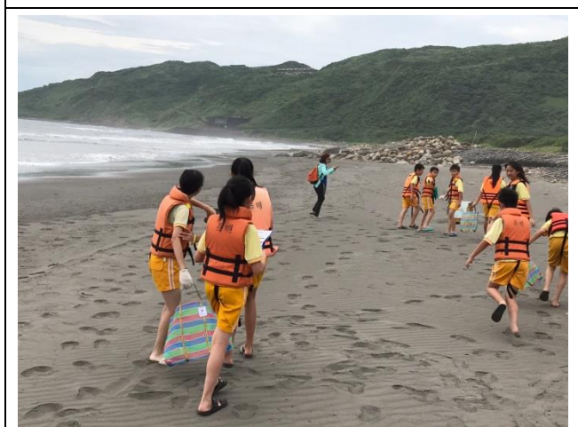
運用科學淨灘認識海岸廢棄物