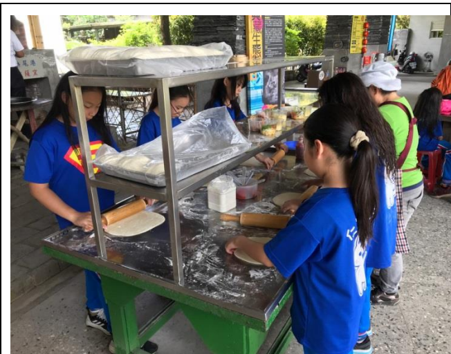
使用當地居民種植的農作物、品嚐自己製作的披薩