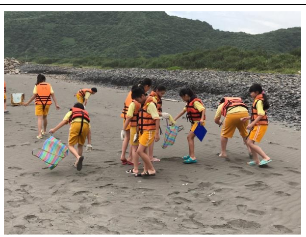
運用科學淨灘認識海岸廢棄物