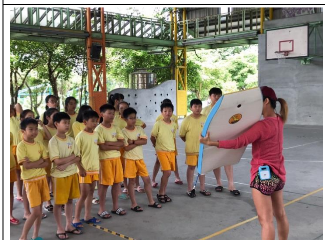
了解安全水域、認識離岸流