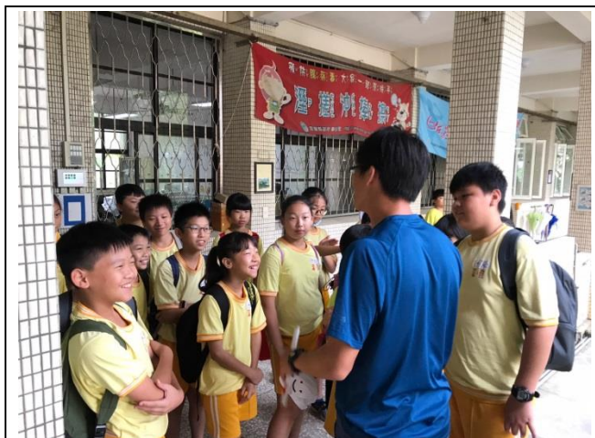
認識岳明國小參觀環保校園