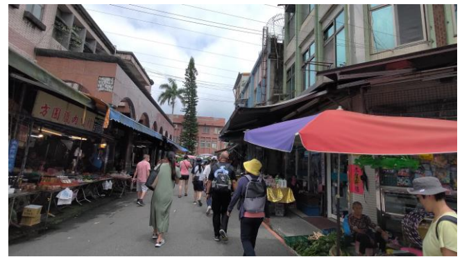
圖片說明：市場中的食魚教育。