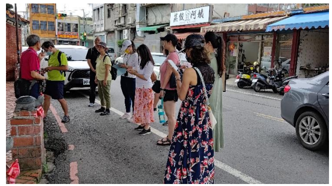
圖片說明：街頭巷尾裡的歷史，其來有自。