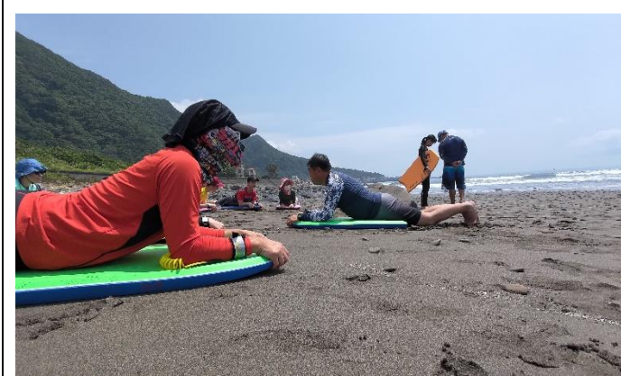
圖片說明：航向大海。