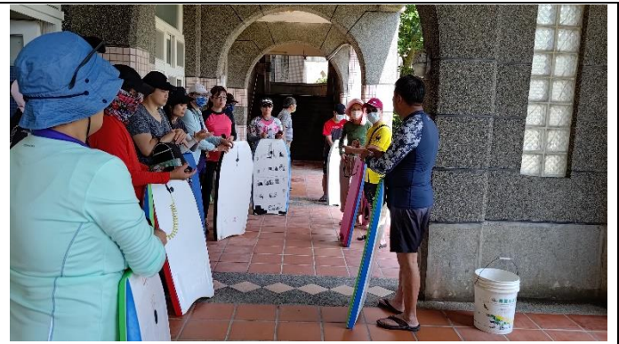
圖片說明：潮汐.水流.氣象的搜尋