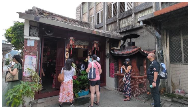
圖片說明：頭城老街中的史料與教學素材