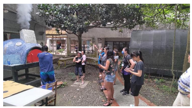
圖片說明：窯烤爐的設計與海洋意象融入及食材的應用。