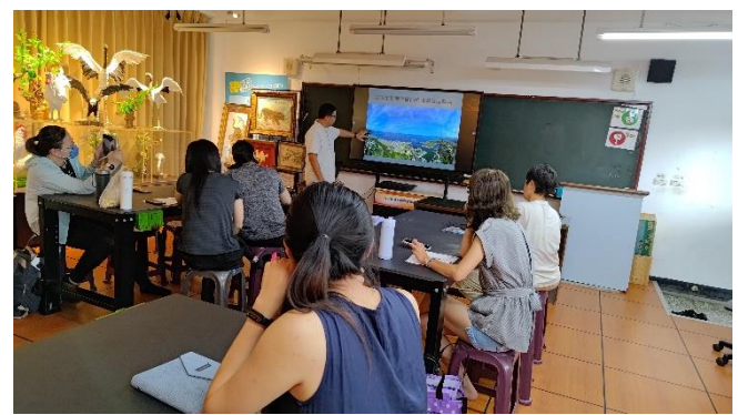
圖片說明：蘭陽博物館的教育理念與規畫