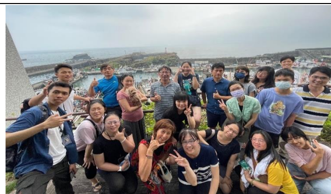
圖片說明：成為維護海洋永續的推動者。