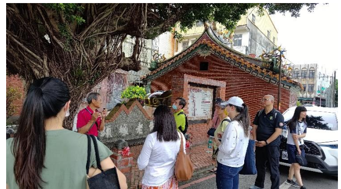
圖片說明：大樹下的開蘭海路發展故事與遺跡