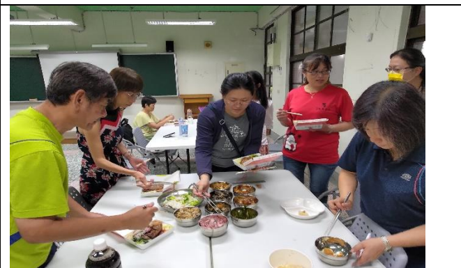
圖片說明：市場中的海味/生活的日常。