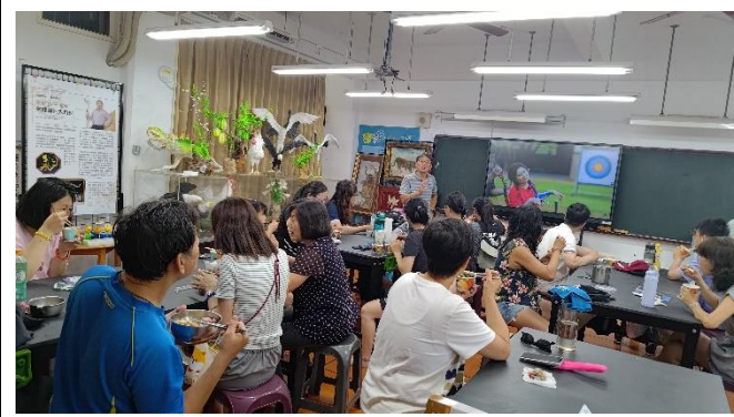
圖片說明：在地學校發展與學生學習/結合在地海洋特色課程發展。