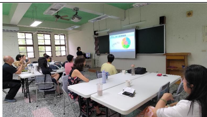
圖片說明：從體驗感受認知活動設計的重要