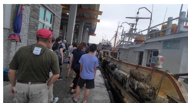
圖片說明：海洋的永續與管理