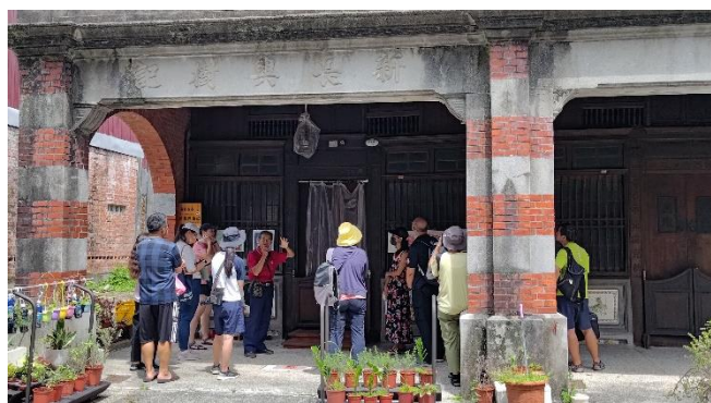
圖片說明：古蹟中的開蘭歷史。