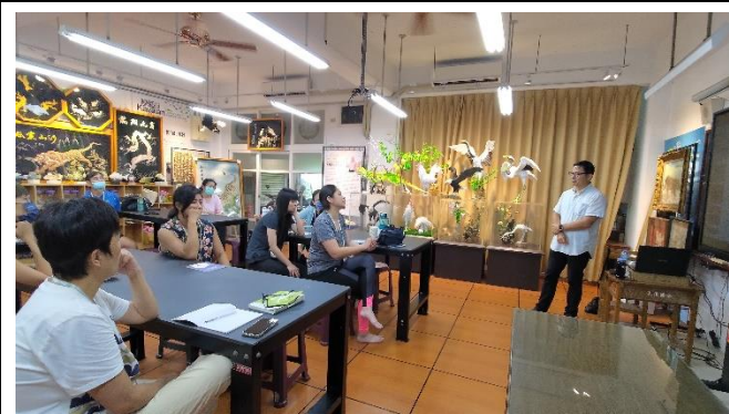
圖片說明：海洋關懷無所不在