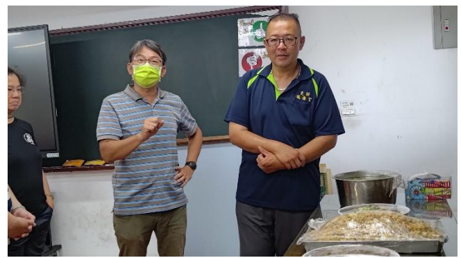
圖片說明：食物旅程/認識在地.吃在地。