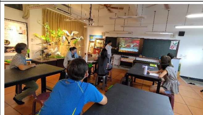
圖片說明：海上勇者-堅持的信念