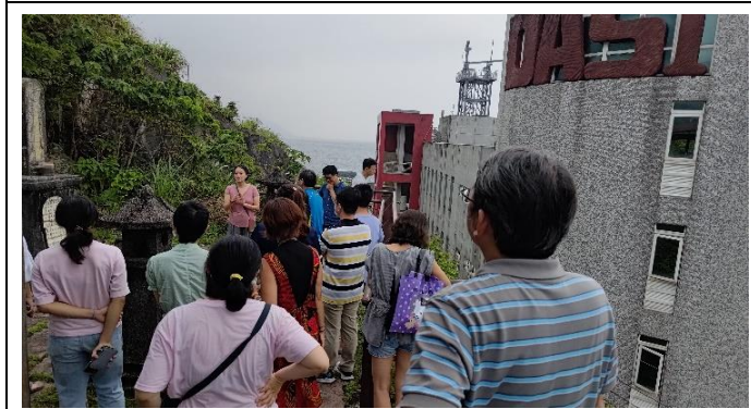
圖片說明：宜蘭漁業管理