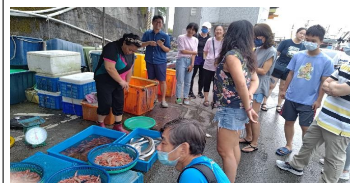
圖片說明：海鮮指南