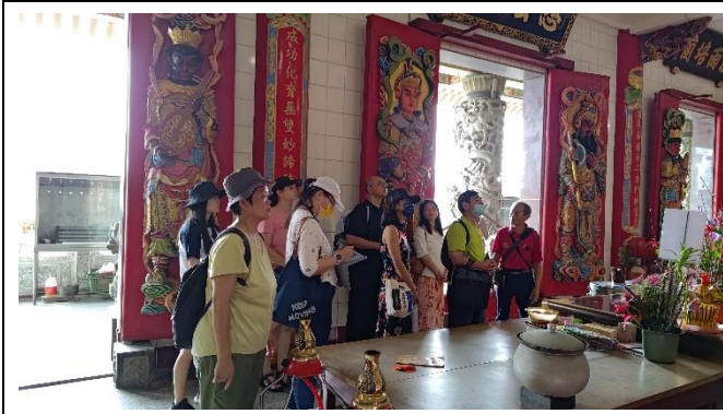
圖片說明：城隍廟裡的開蘭物語-先民的故事。