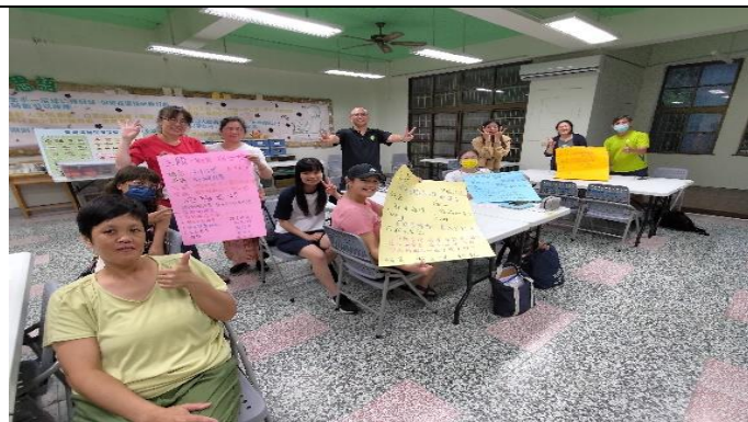
圖片說明：合作學習，綠階培訓圓滿結訓。