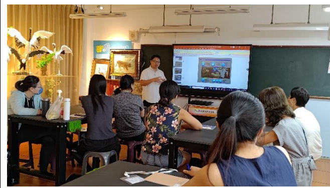
圖片說明：館長介紹蘭博及宜蘭海洋歷史與發展。