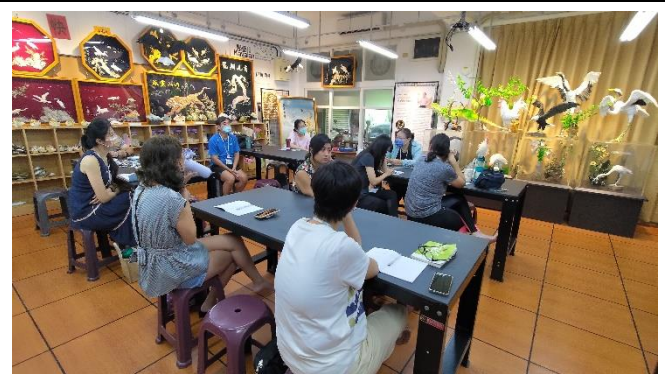
圖片說明：互動提問，主動學習。