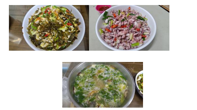
圖片說明：食材中的故事/海帶麵/現撈小卷的蠶與鮮/魷仔魚羹的故事