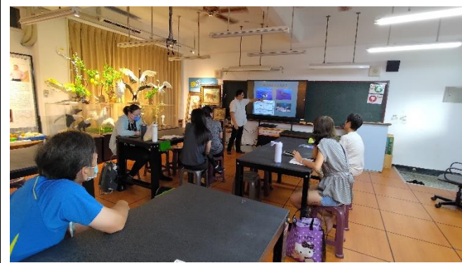
圖片說明：航向大海的理念分享