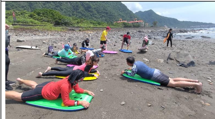
圖片說明：救生員配比及水域安會裝備，