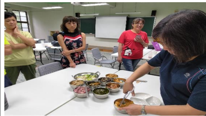
圖片說明：說明與操作