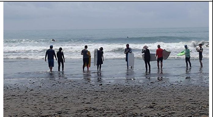
圖片說明：戶外教育與海洋教育體驗學習，了解場域與教學設計的關係。