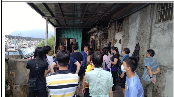
圖片說明：漁業產業關係