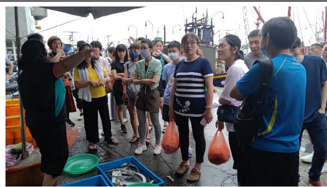
圖片說明：漁法演進的漁業文化