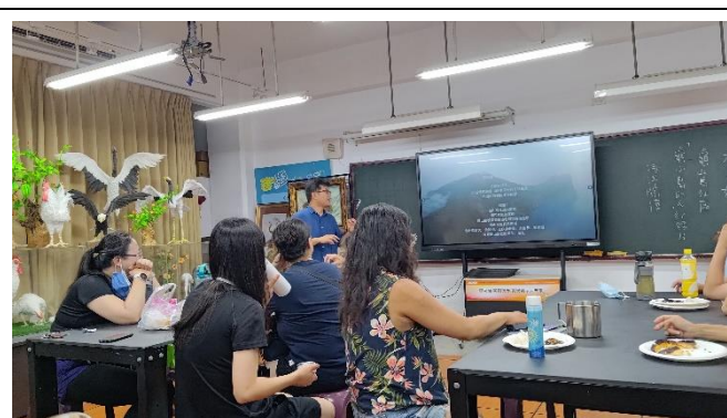
圖片說明：生物調查與海洋