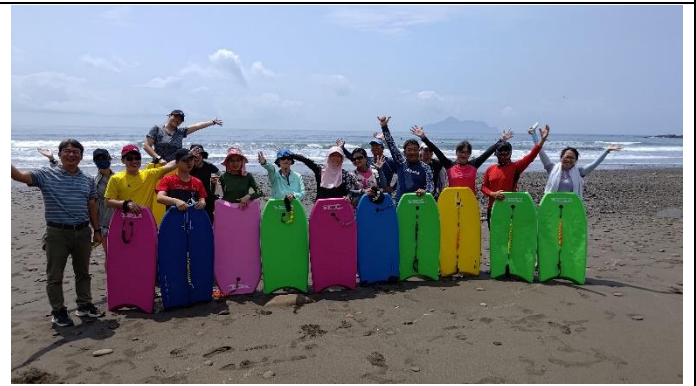
圖片說明：團體動力.團隊合作。