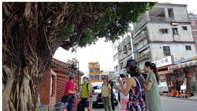
圖片說明：歷史衍生文化，淵遠流長