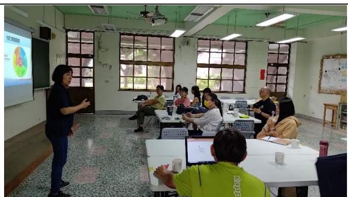
圖片說明：分享與討論