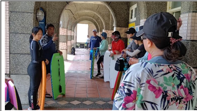
圖片說明：水域安全教育