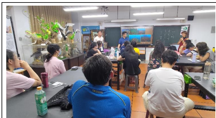
圖片說明：漁業與環境教育

(一)海洋概論-分享在地團隊如何將龜山島遷村的故事、漁村的記憶與海洋文化的深層意義，透過創新的方式留下。而從過去歷史，看現在發展的現況及瓶頸，思考未來宜蘭的漁村文化及教育功能。