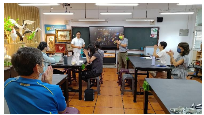
圖片說明：蘭陽博物館的規畫發展與海洋教育的關係。