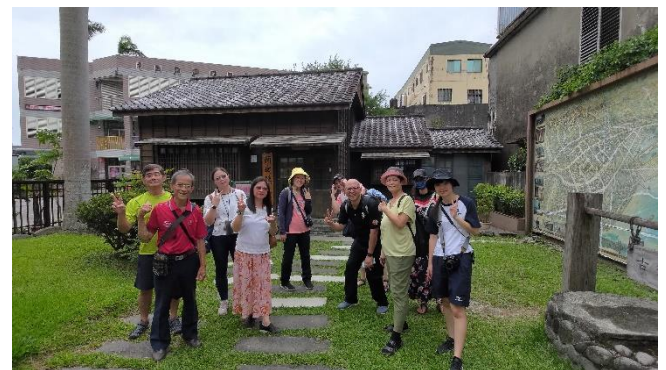
圖片說明：走讀頭城老師-李榮春文學館.尋找開蘭歷史與文化足跡。