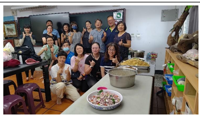
圖片說明：食魚教育...做中學。