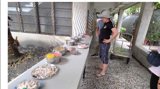
圖片說明：海鮮與披薩_生活中的食魚學問與操作。