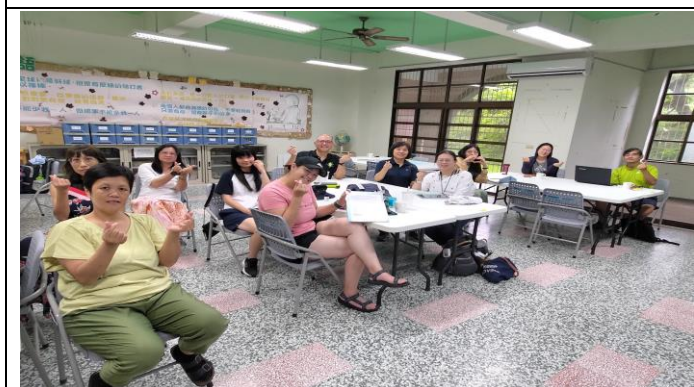
圖片說明：共識凝聚與教育實踐