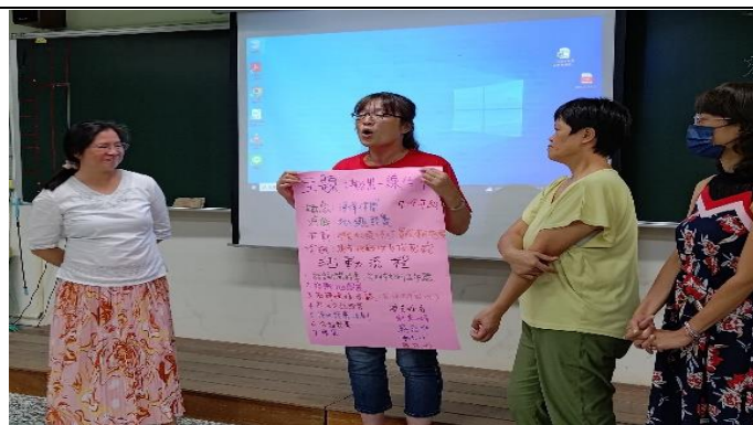
圖片說明：分組討論.報告.交流.學習。