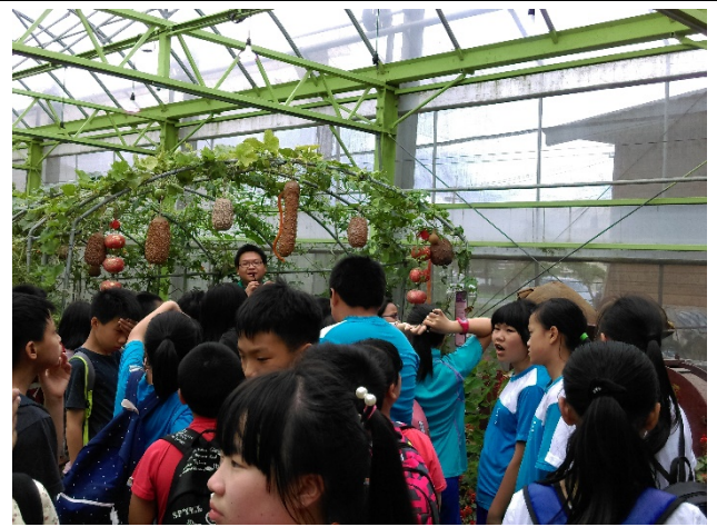
◆◆解說現代科技如何運用在農業栽培