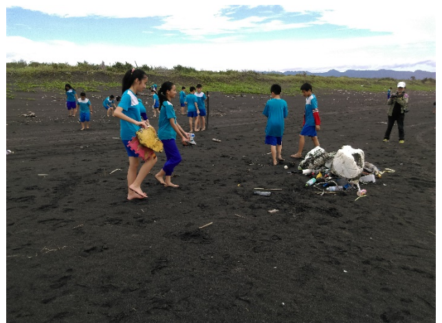
◆淨灘，留下淨美的海灘