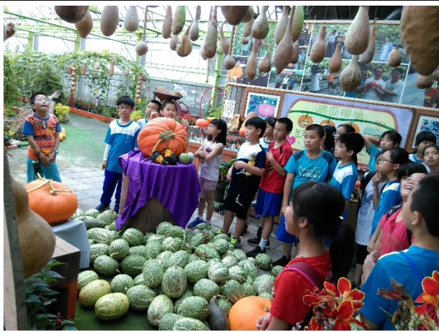
◆◆尋找傳說中的北瓜