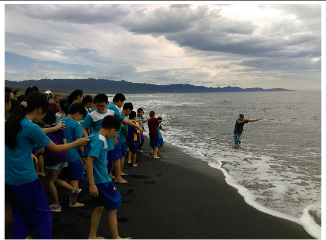
◆跟著耆老準備牽罟