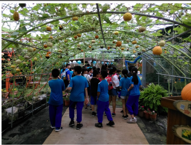
◆◆認識各種不同的瓜果