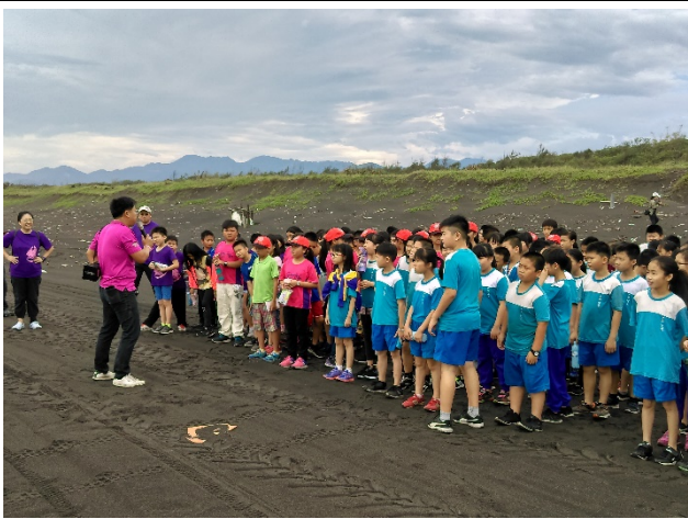
◆張總幹事解說牽罟的流程