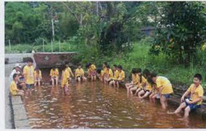
泡冷泉好舒服 體驗蘇澳的文化特色