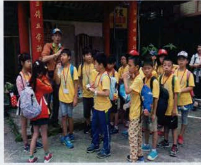
走讀蘇澳老街廟宇 認識她美麗的歷史故事