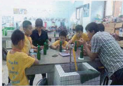
蘇澳國小迎賓直笛表演 很用心 彈珠汽水瓶電雕很神奇