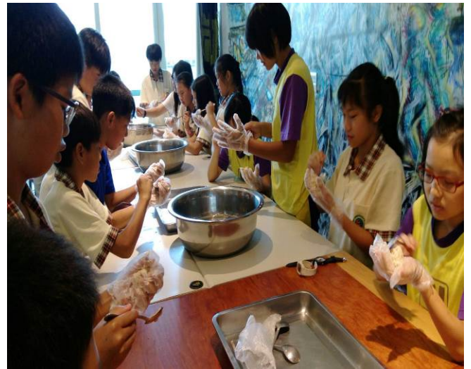
照片說明：動作製作魚丸