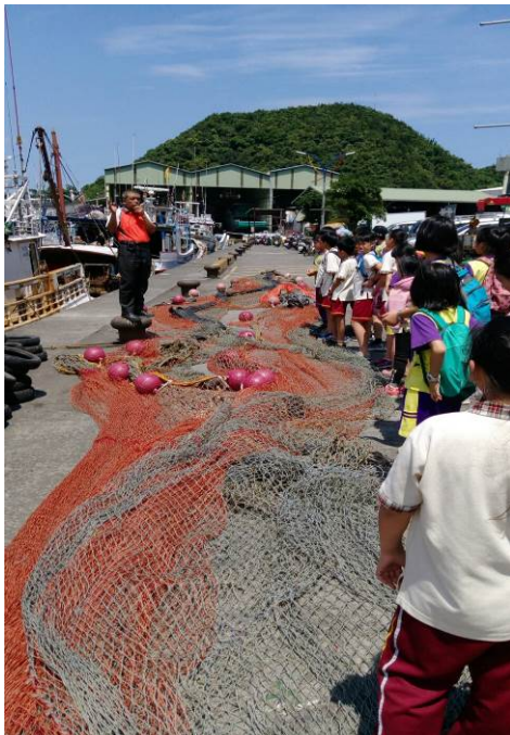
照片說明：漁港巡禮，聽解說