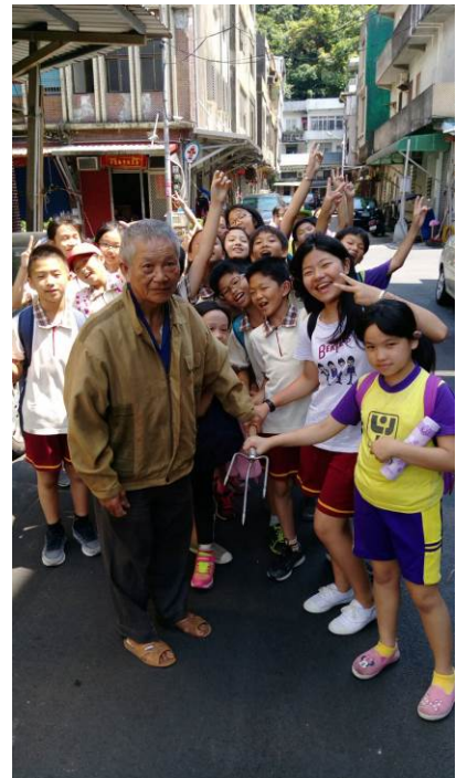
照片說明：與製作魚標的先生合照