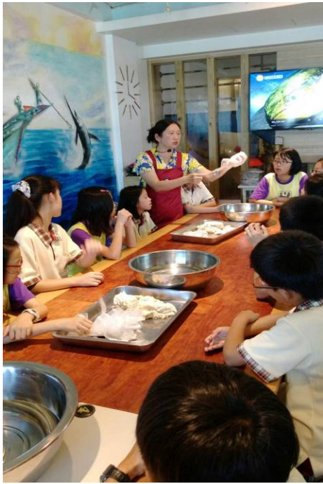
照片說明：製作魚丸前觀賞示範