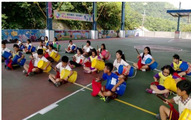
照片說明：油桶鼓節奏敲擊練習