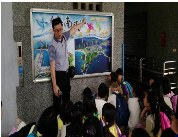
照片說明：透過漁港地圖，介紹南方澳周邊環境。