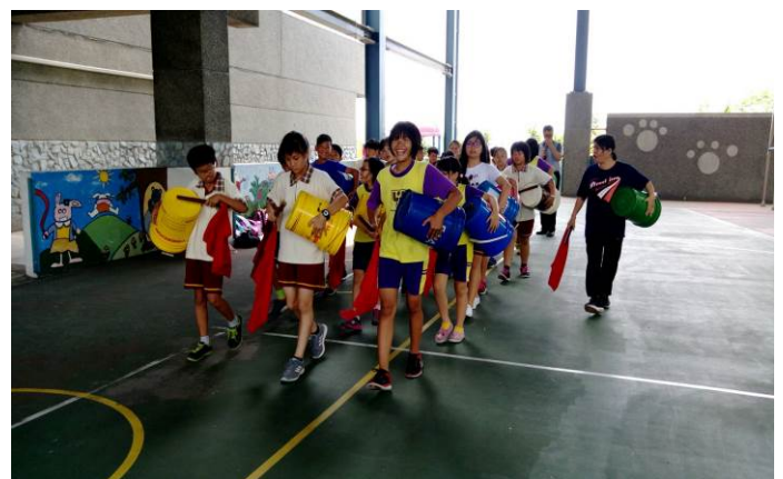
照片說明：油桶鼓展演~踩街活動