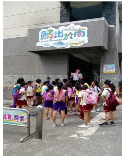
照片說明：介紹南安國小學校特色！