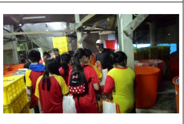
參觀皮蛋製作的流程，結束充實的體驗行。