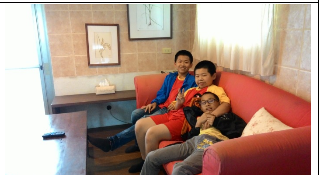
在飛鳥小屋裡盈滿自然舒適的氛圍。