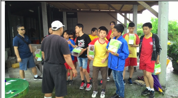
前往信仁牧場聆聽鴨場主人說明蛋鴨生態。