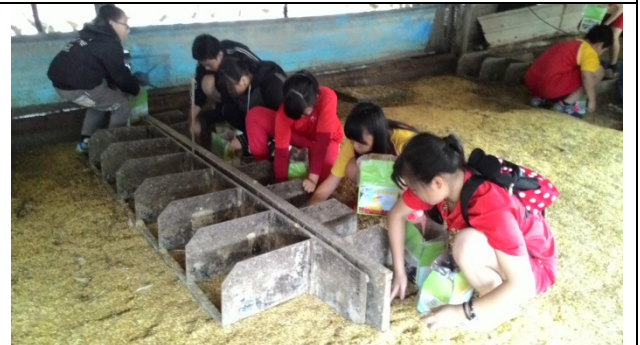
同學在鴨場裡撿拾今日最新鮮的鴨蛋。