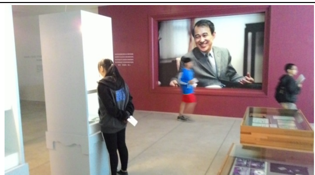
在陳定南紀念館內瞻仰老縣長風采。