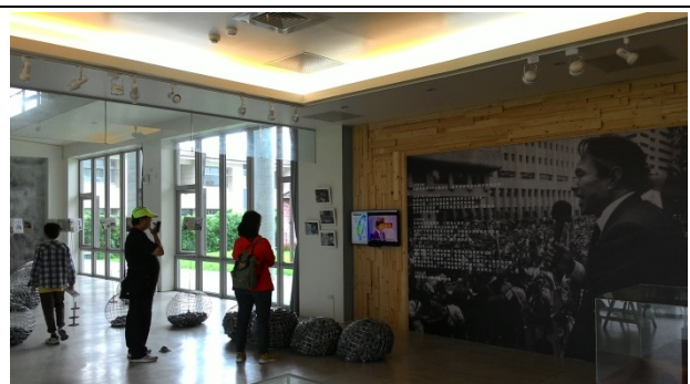
在陳定南紀念館內耳目清心六根清靜，一如朗朗青天。