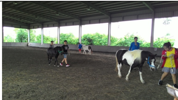
在大洲馬場牽馬體驗，今日就當個小馬伕。