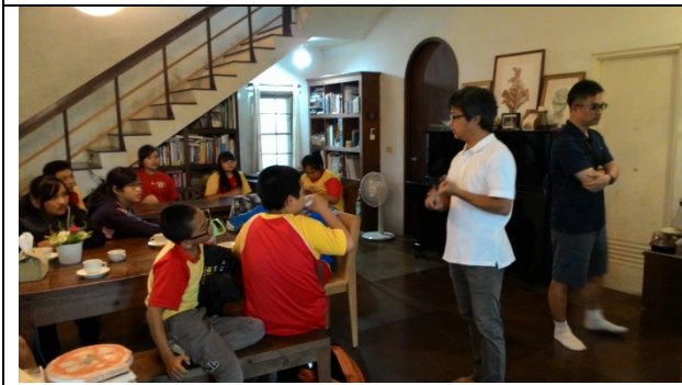
飛鳥小屋民宿主人說明民宿現況與個人經營理念。