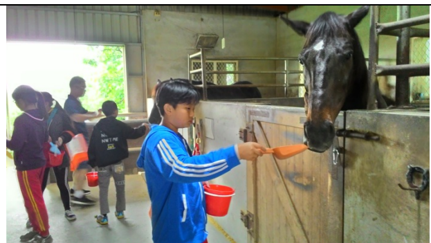
在大洲馬場餵食馬兒，馬兒頗有靈性。