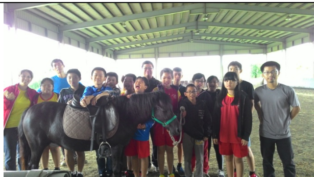
感謝大洲馬場辛苦的馬兒，忍辱負重陪我們體驗。