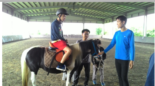
一躍上馬好不威風，且看我騎馬英姿。