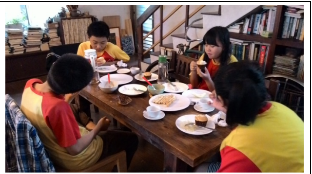
飛鳥小屋手做歐式簡易料理，食材講究天然揉入健康元素。