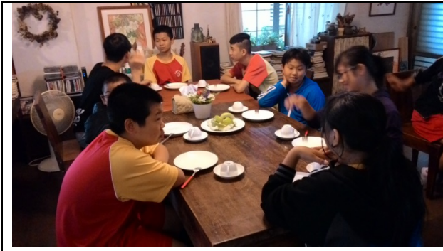
到飛鳥小屋民宿享用民宿客製化的服務。