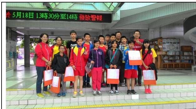
有朋自遠方來不亦樂乎，大家相見歡！