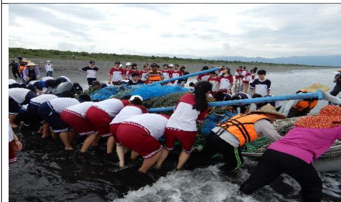
同學與社區居民同心協力推船入海