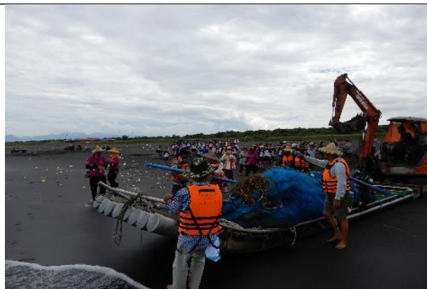
祭祀海神以及船隻下水