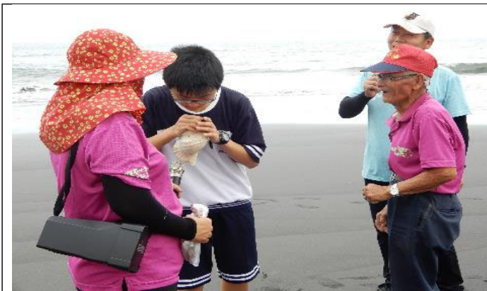
同學挑戰能不能吹出聲音