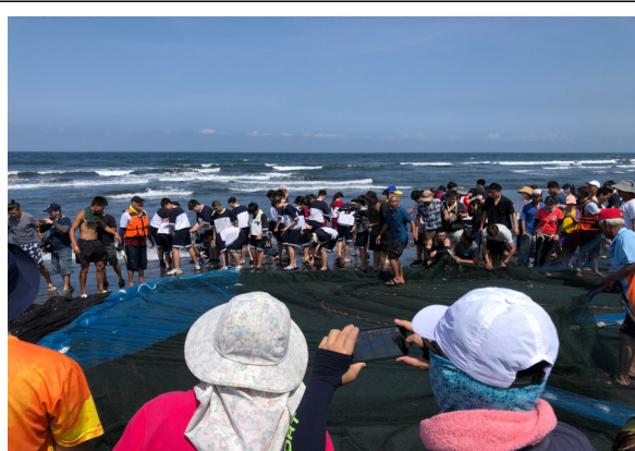
同學協助整理漁網