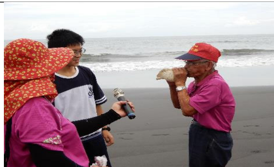
由社區耆老展示牽罟第一步驟-吹螺