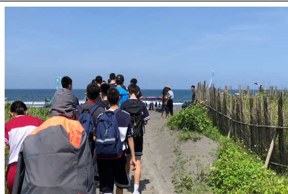
從社區步行至海邊準備牽罟