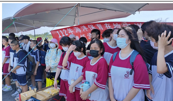
在沙灘上說明牽罟的流程