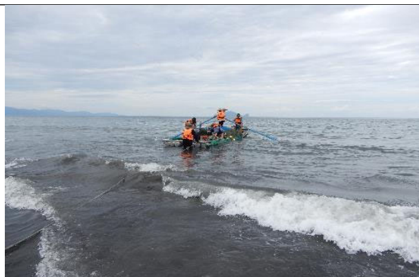
牽罟船將漁網繩牽入大海