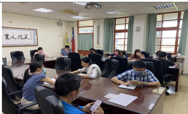
進行戶外教育課程前， 教師進行活動流程討論