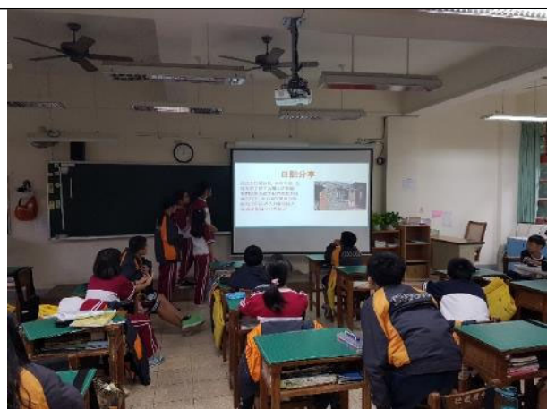
學生課堂報告心得