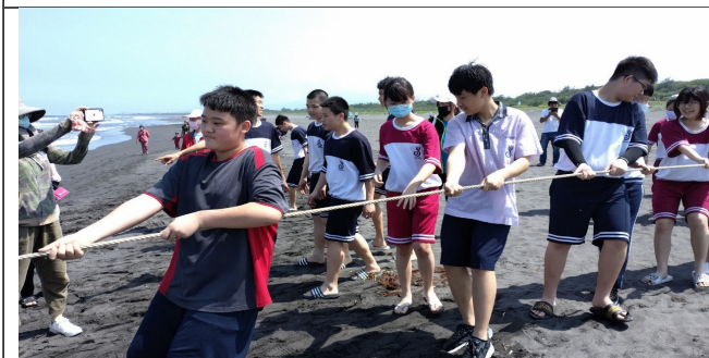
一起拉繩，體驗牽罟