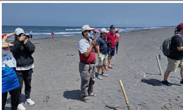
社區理事長講解牽罟注意事項