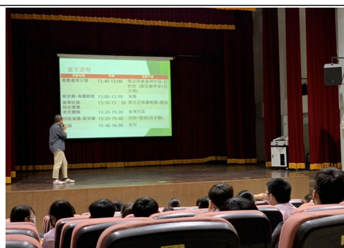
出發前安全注意事項及行前說明