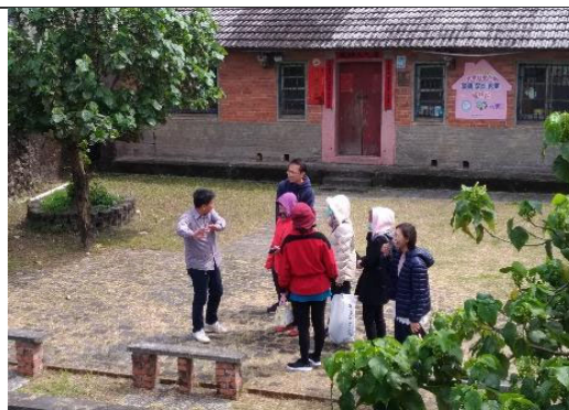
社區理事長講解社區總體營造運作情形