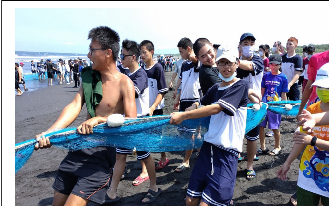
和社區居民合力將網繩拉上岸